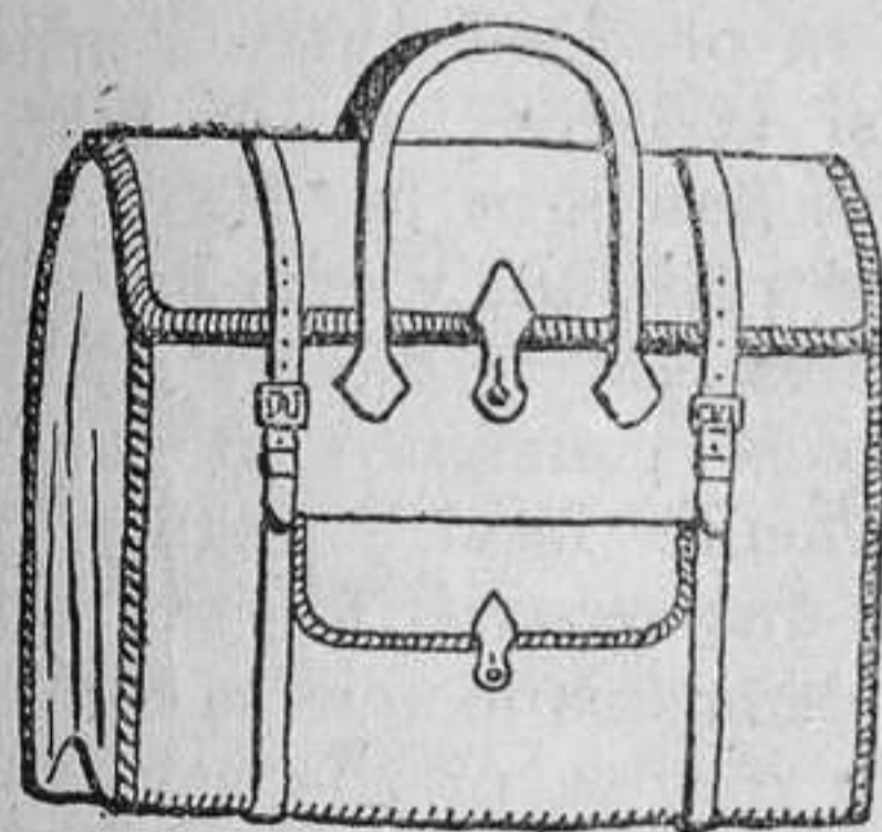
Pequeña maleta, que puede hacerse en casa.

La moda: Un saco de viaje. —Dejemos hoy, lectora amiga, los trajes y perifoneos para tratar de una labor más modesta aunque no menos útil; proponemos