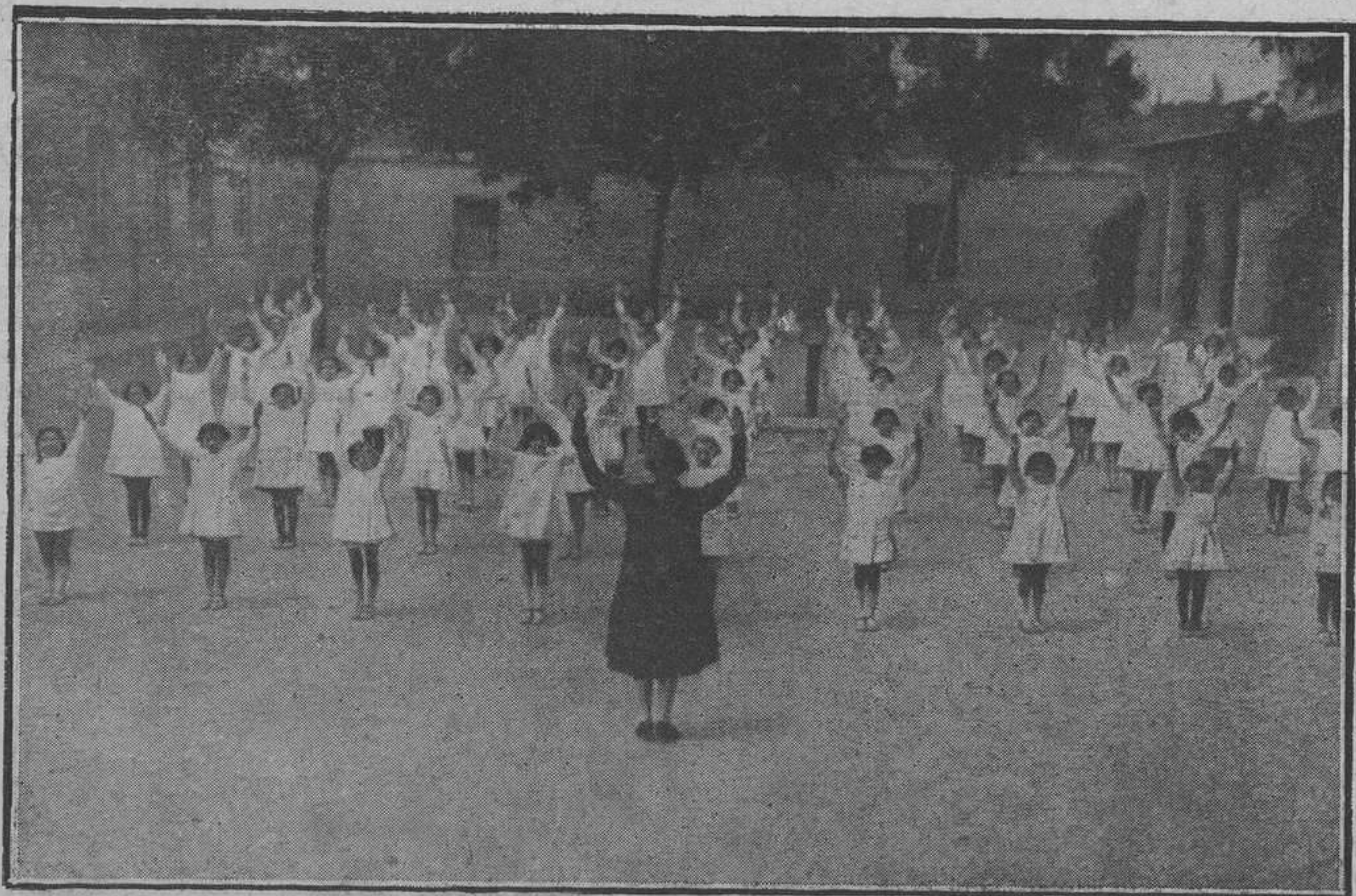
Sección de ginnasia.

En la clase de taquigrafía y mecanografía, la profesora, de consuno con la directora, observan a las muchachas que