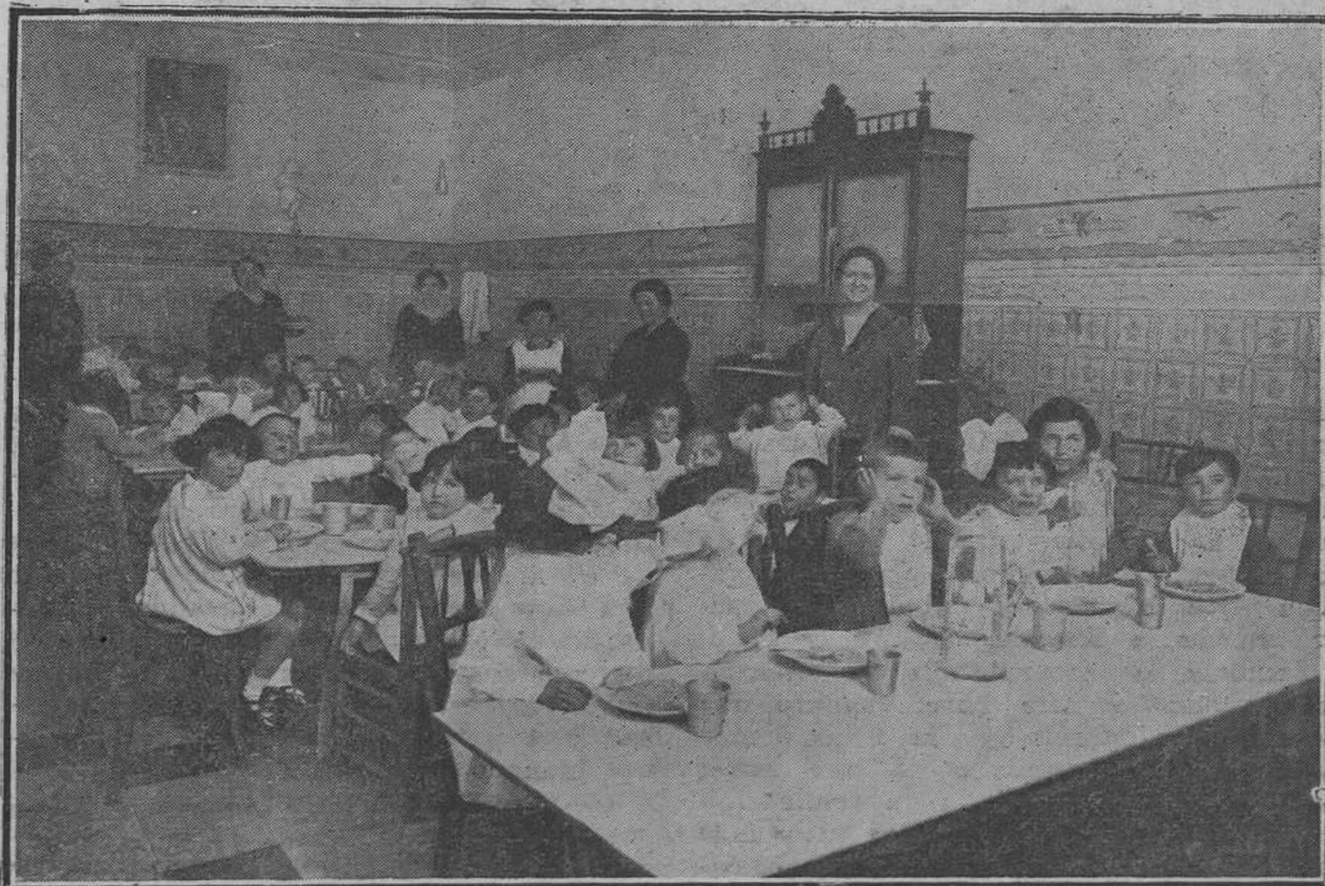
Niñas de la sección maternal en el comedor.

«Nuestras aspiraciones—me dice la directora—son que toda niña que asista a la Escuela salga de ella sabiendo, por lo menos, leer, escribir y un mínimo pro