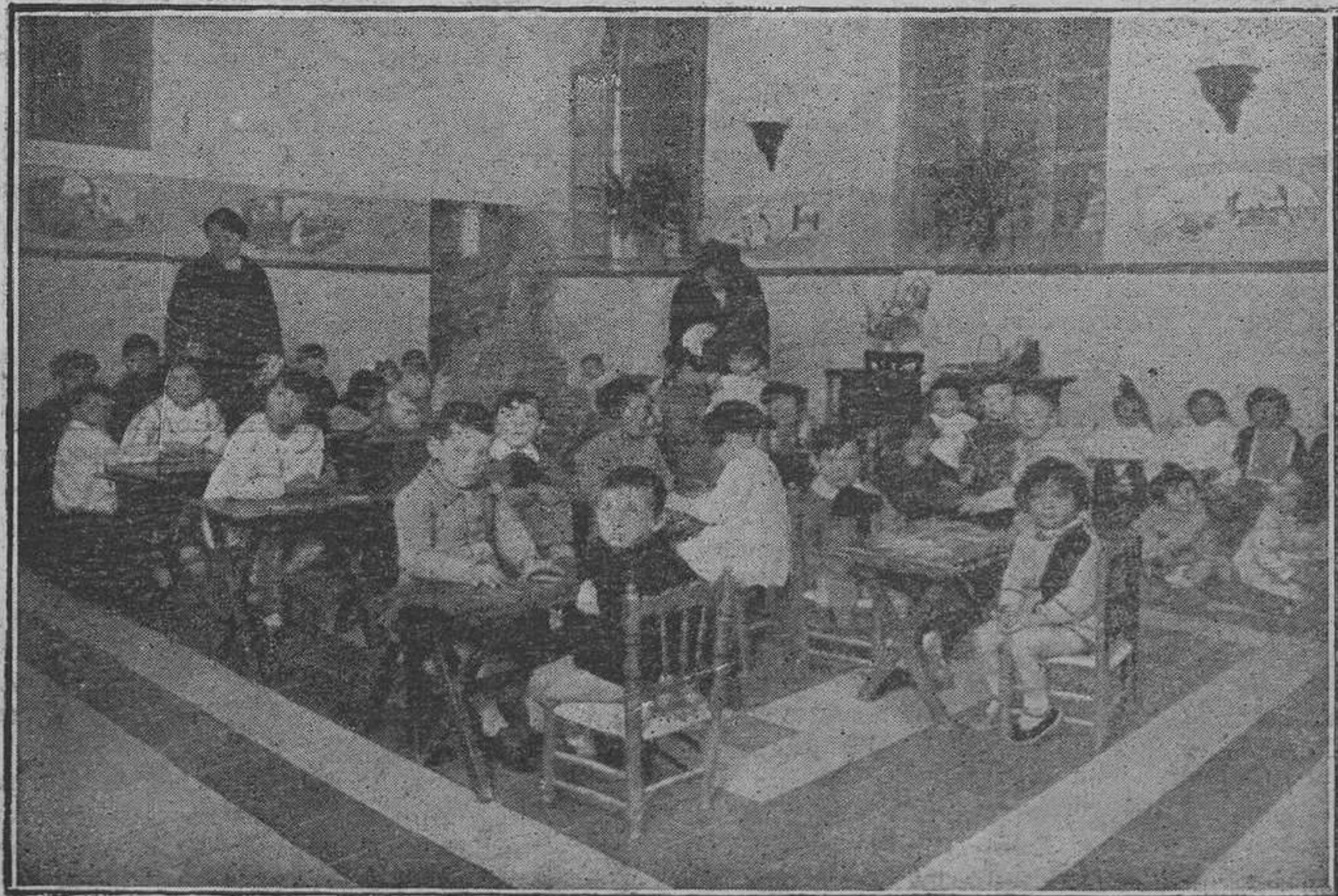
La sección maternal trabajando con el material Montessori.

hemos aludido, detalles de las circunstancias todas que concurrieron a proyectar el edificio, su inauguración, etc. Lo que hemos de citar hoy es que esta sección de niñas a que queremos referirnos, tiene establecido un grado de párvulos, uno