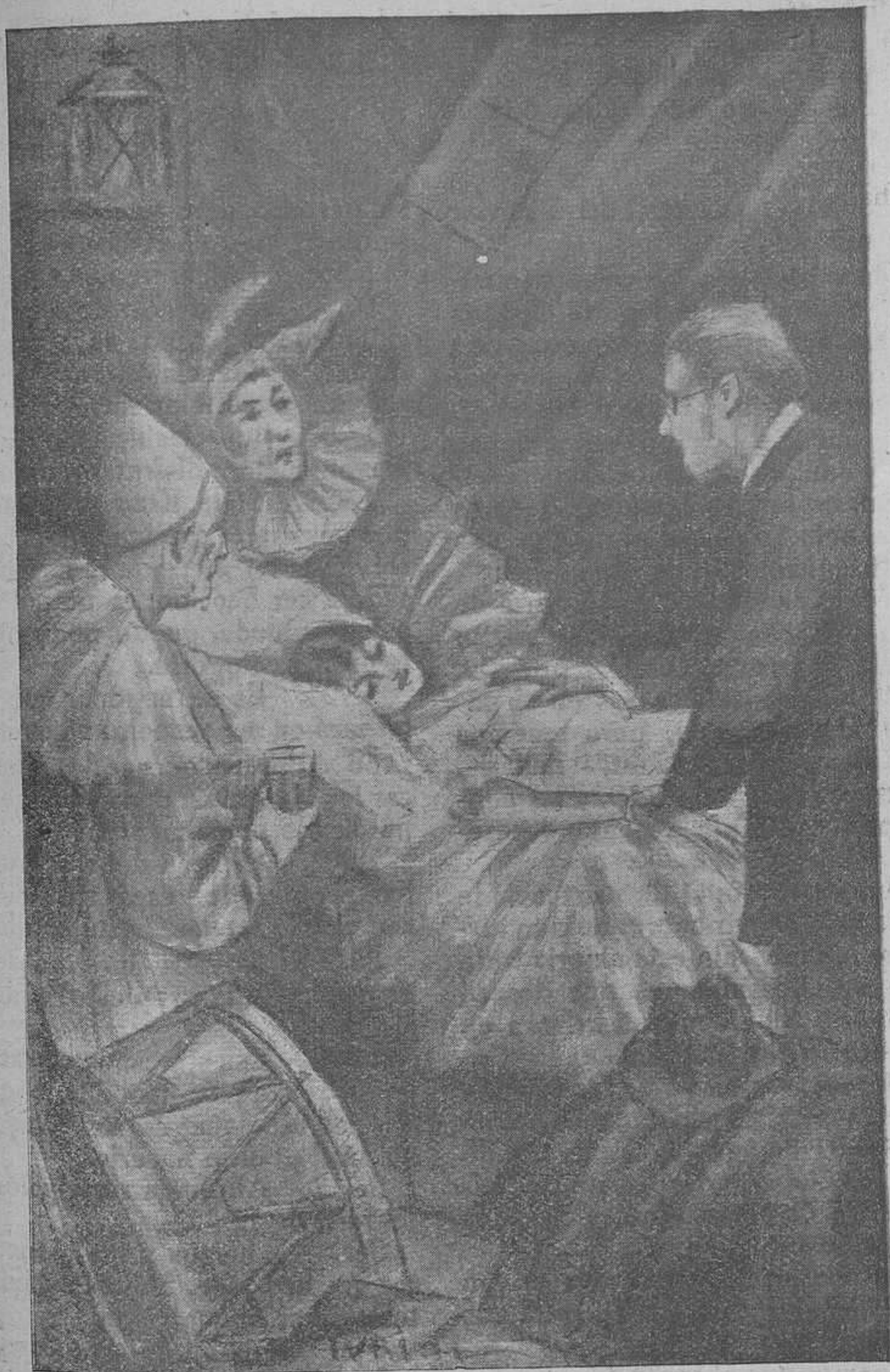
«Mariposa» ha muerto. Su cuerpo de nácar está...

Por J. LILLO RODELGO.—INSPECTOR DE PRIMERA ENSEÑANZA