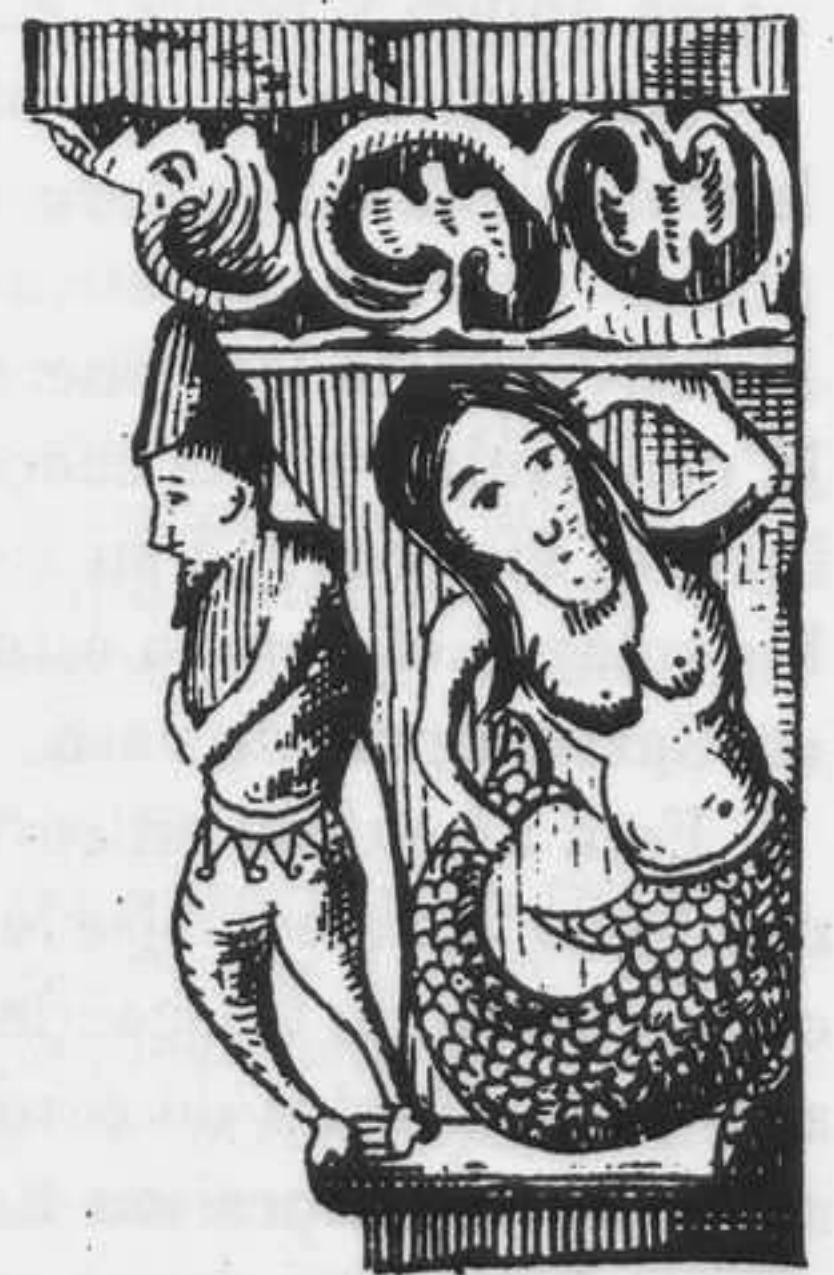
ZAMORA.—Capiteles de la iglesia de San Claudio de Olivares.