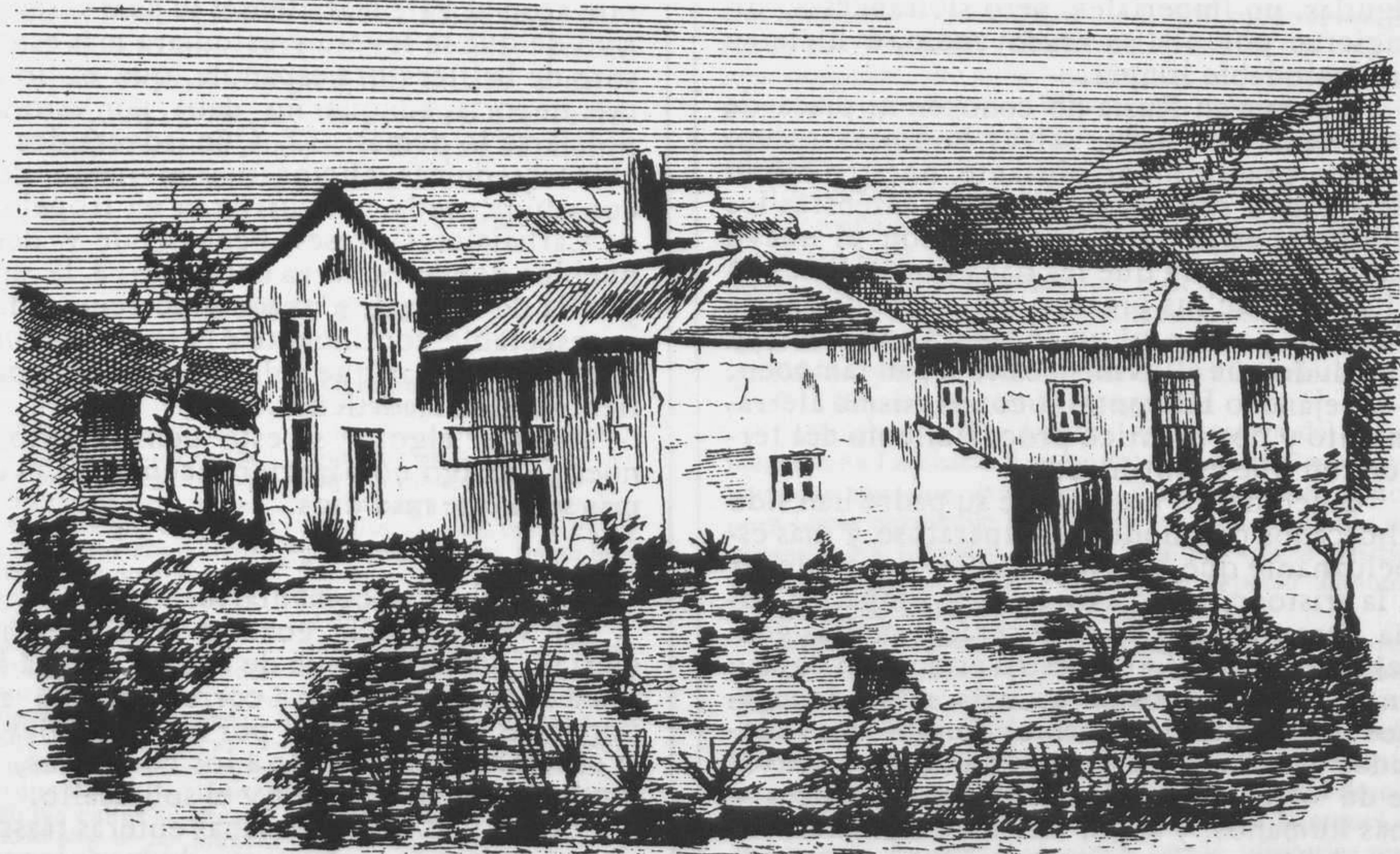
ZAMORA.—Casa-hospedería en la inmediaciones del lago de Sanabria.

1.º Los señores no suscritores de dentro y fuera de la capital que se han acercado á nuestra redaccion ó escrito á la misma deseando serlo en adelante y pidiendo colecciones de este semanario, se servirán, si gustan favorecernos, remitir á dicha redaccion notas de nombres y apellidos pues deseando corresponder nosotros á tan inmerecido favor, nos proponemos, despues de formar lista de los peticionarios, hacer reimpression de los números agotados, porque al hacer las tiradas anteriores aunque se incluyeron ejemplares en número superior al de suscritores, los pedidos é ingresos sucesivos han consumido nuestro fondo de reserva.—Los señores que vienen honrándonos con la ayuda de su suscripcion desde el principio, pueden tambien revisar sus colecciones, y si se les hubiere extraviado algun número, tengan la bondad de avisar á esta redaccion para suministrárselo en cuanto se reimprima.—2.º—Terminado con este número el segundo mes de la publicacion, los Sres. suscritores de FUERA DE LA CAPITAL que no han remitido aún el importe de su suscripcion correspondiente á los dos meses vencidos, se servirán remitirlo ántes del 15 de Mayo próximo, pues de otro modo se calcularán como bajas para el efecto de la reimpression que se proyecta y no podremos ya servirles mas números para poder atender á otros señores que nos favorecen con su puntual pago.