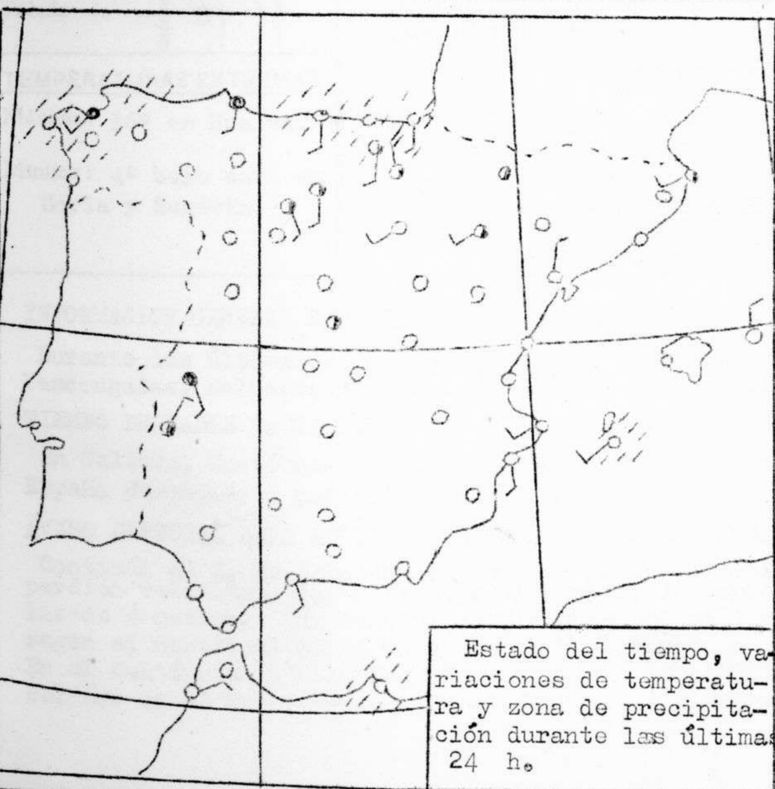
Estado del tiempo, variaciones de temperatura y zona de precipitación durante las últimas 24 h.