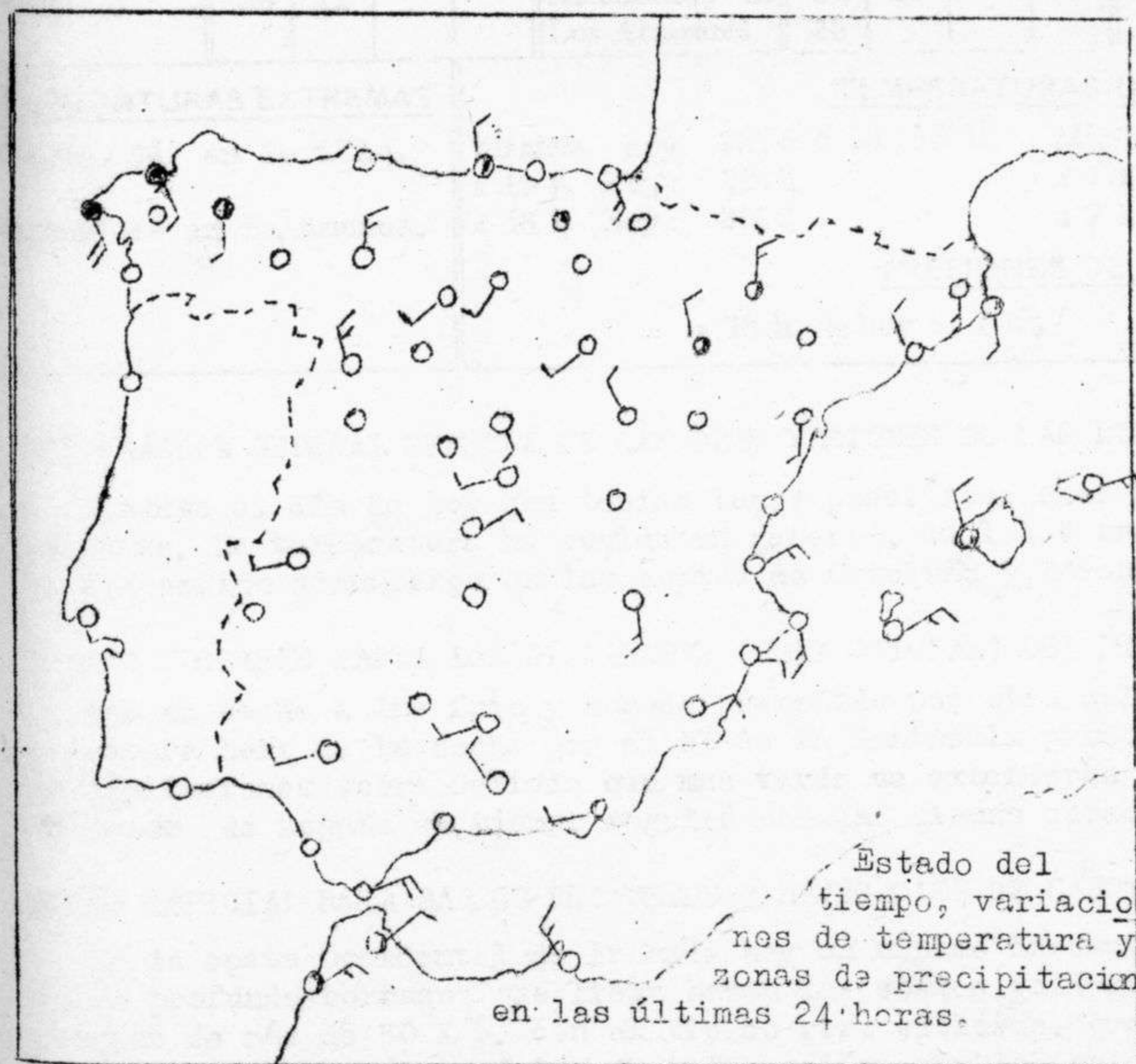
Estado del tiempo, variaciones de temperatura y zonas de precipitación en las últimas 24 horas.