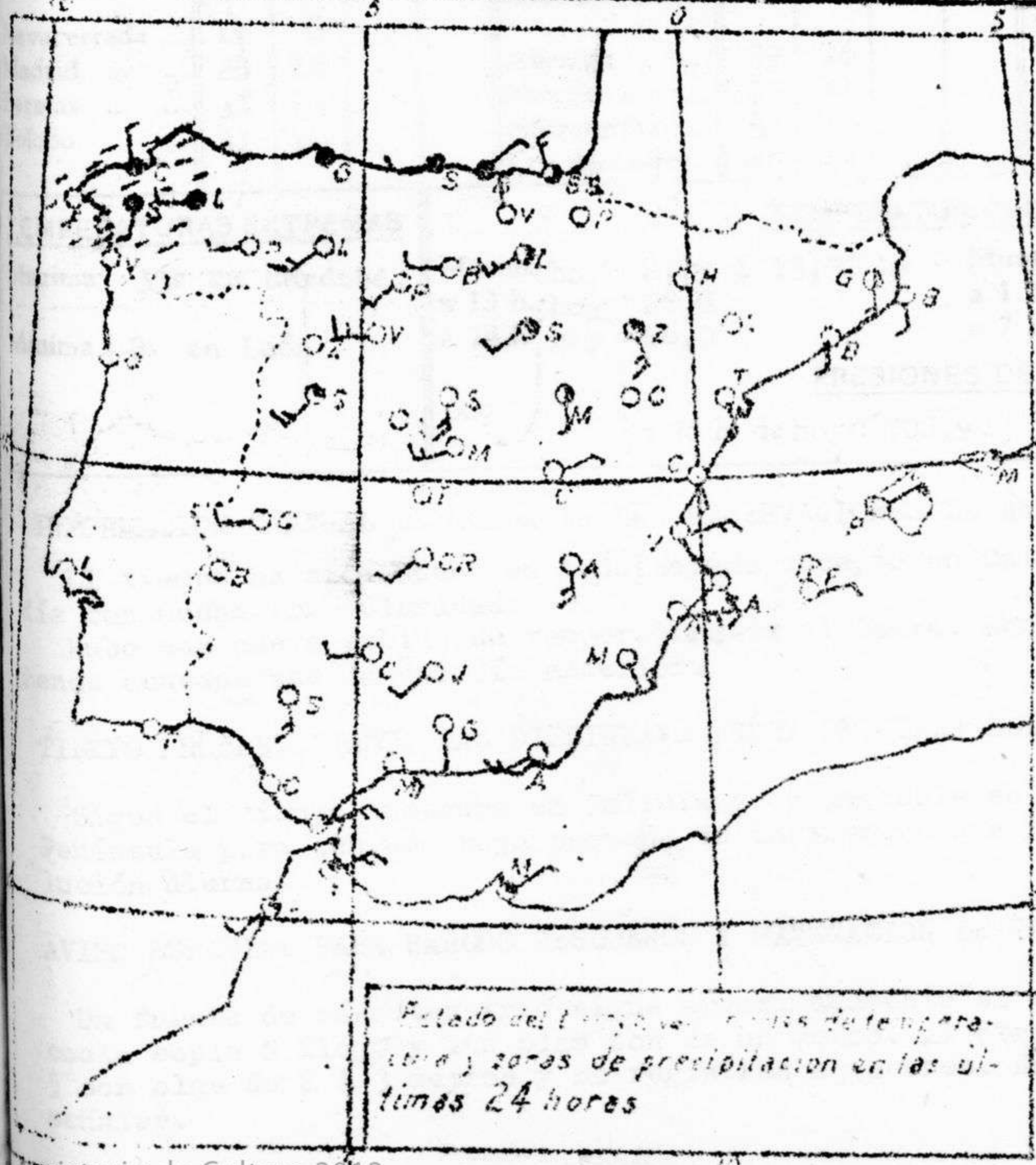
Estado del tiempo, zonas de temperatura y zonas de precipitación en las últimas 24 horas