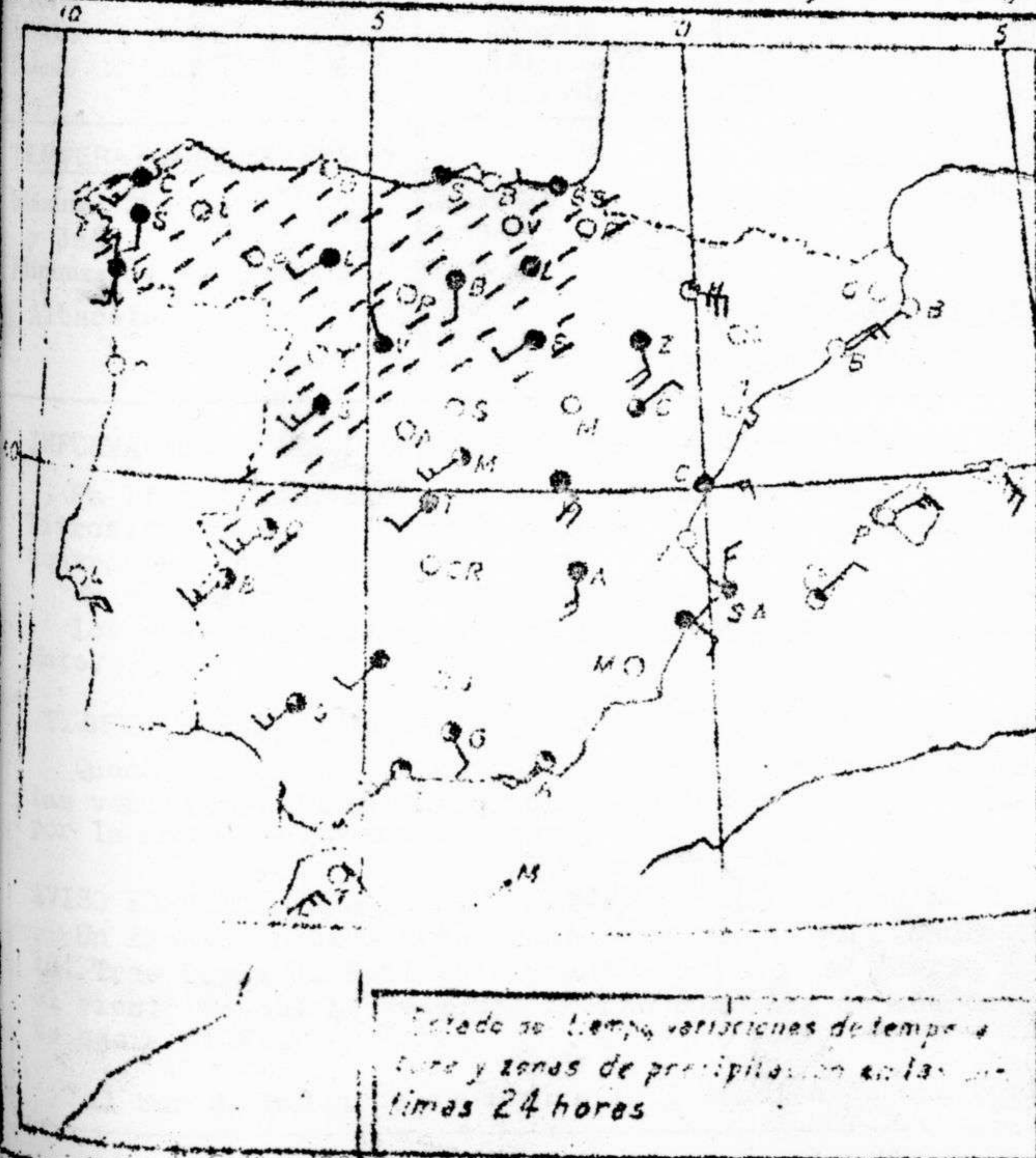
Estado de tiempo, variaciones de tiempo y zonas de precipitación en las últimas 24 horas