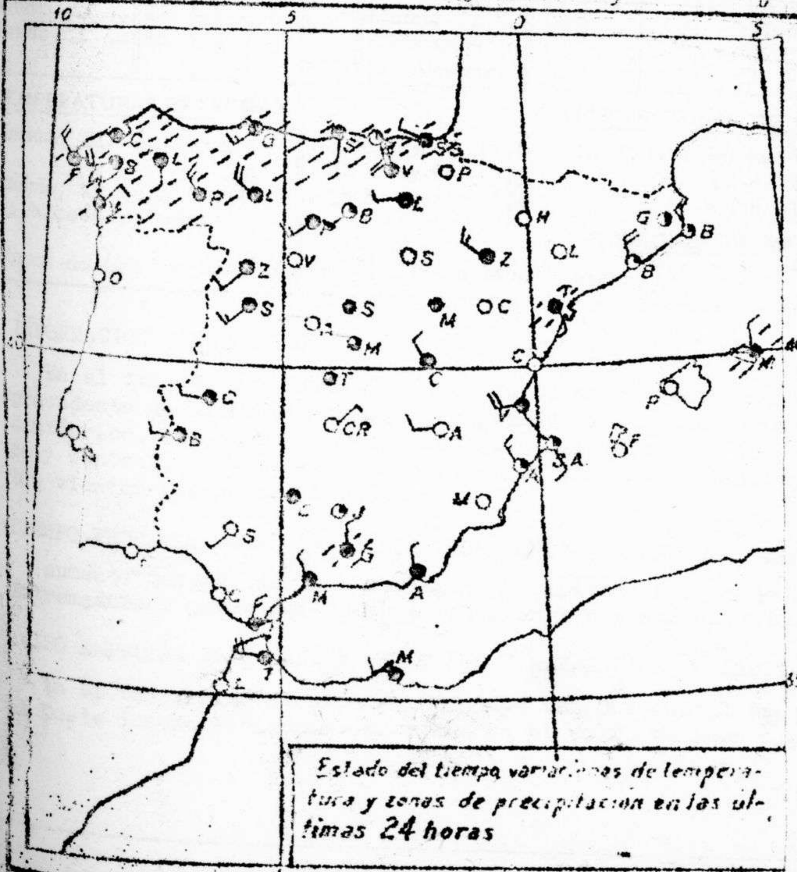
Estado del tiempo, variaciones de temperatura y zonas de precipitación en las últimas 24 horas