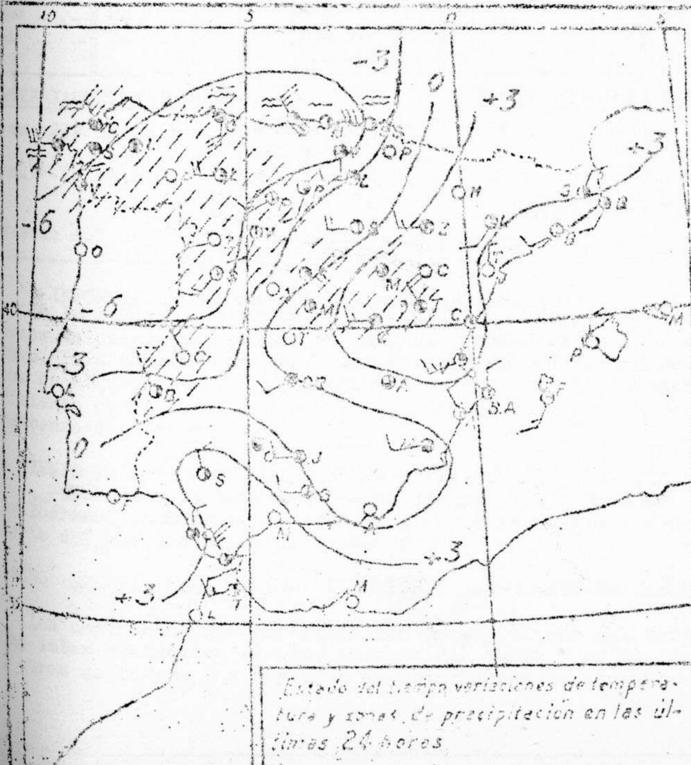
Estado del tiempo variaciones de temperatura y zonas de precipitación en las últimas 24 horas