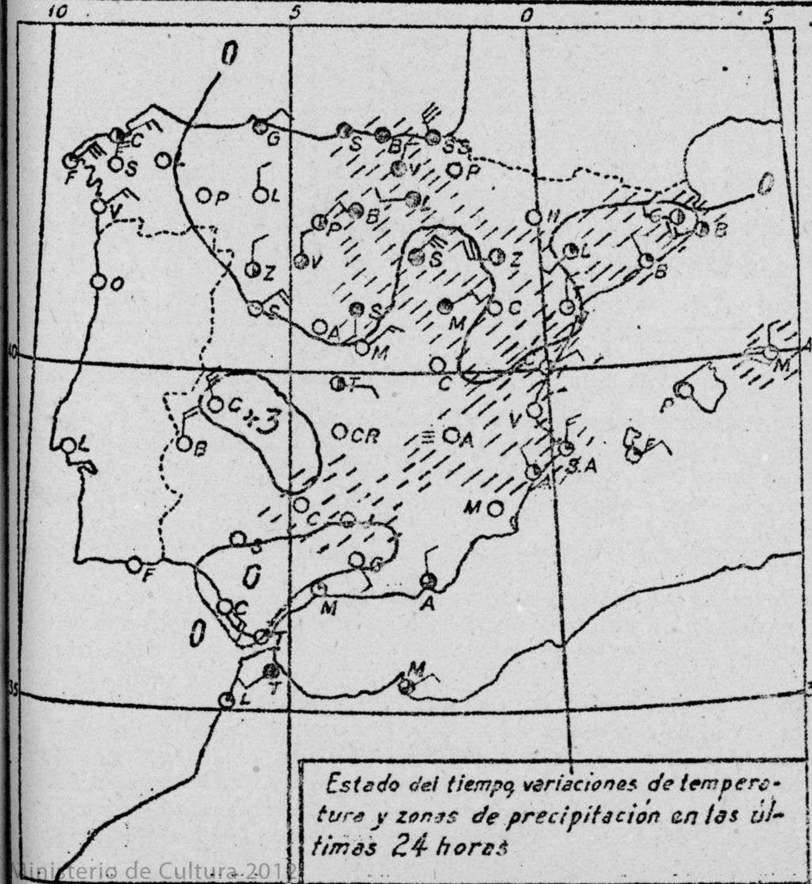
Estado del tiempo, variaciones de temperatura y zonas de precipitación en las últimas 24 horas