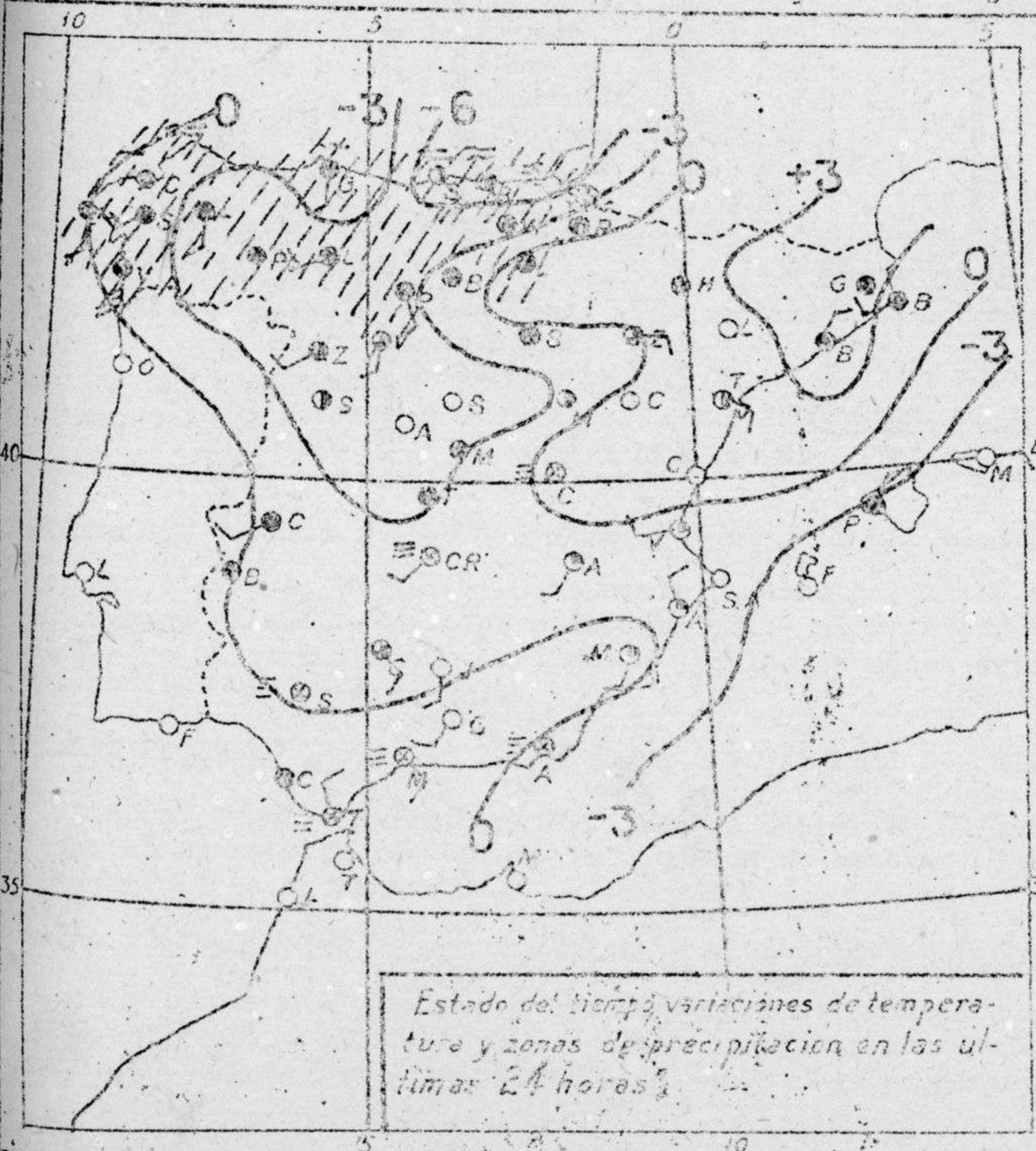
Estado del tiempo, variaciones de temperatura y zonas de precipitación en las últimas 24 horas.