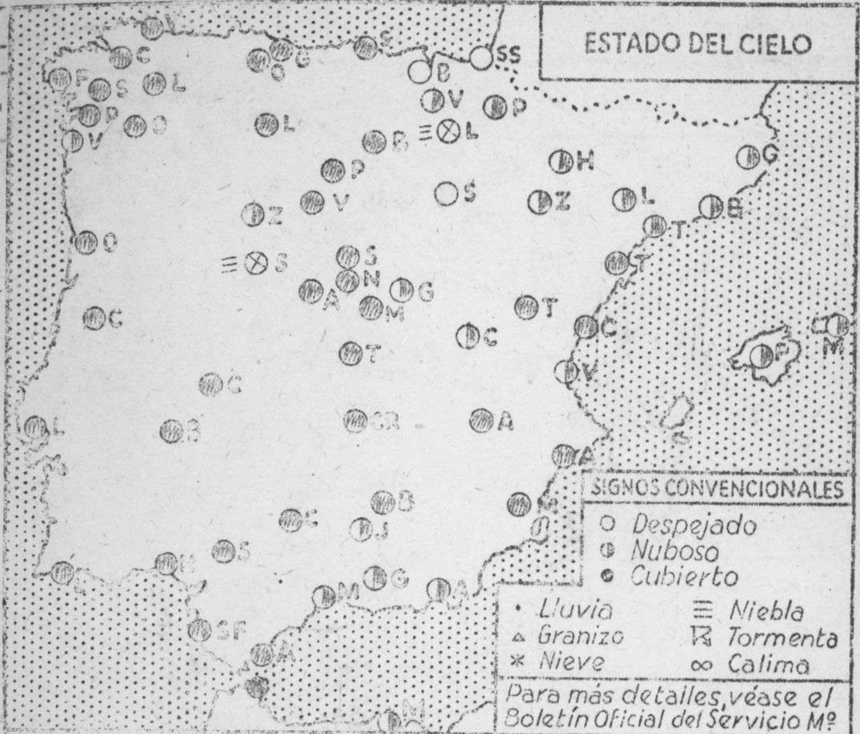
ESTADO DEL CIELO