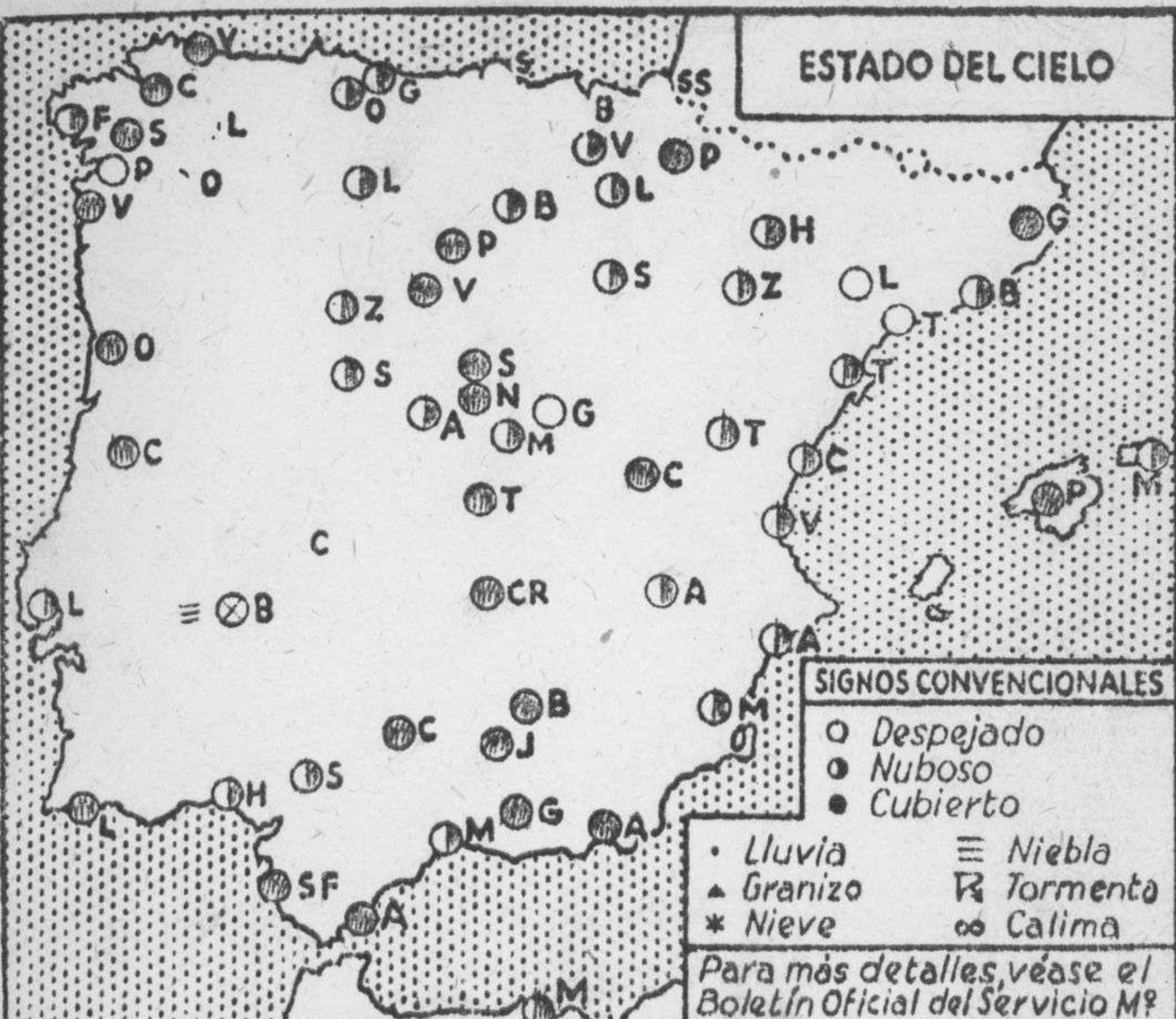
ESTADO DEL CIELO