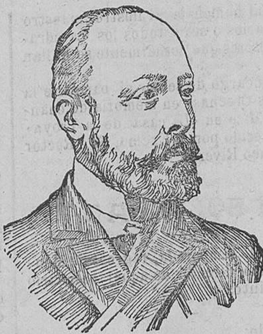
El famoso general italiano Caneva, jefe que fué durante la guerra del ejército de El Carso, que ha fallecido repentinamente en Roma.