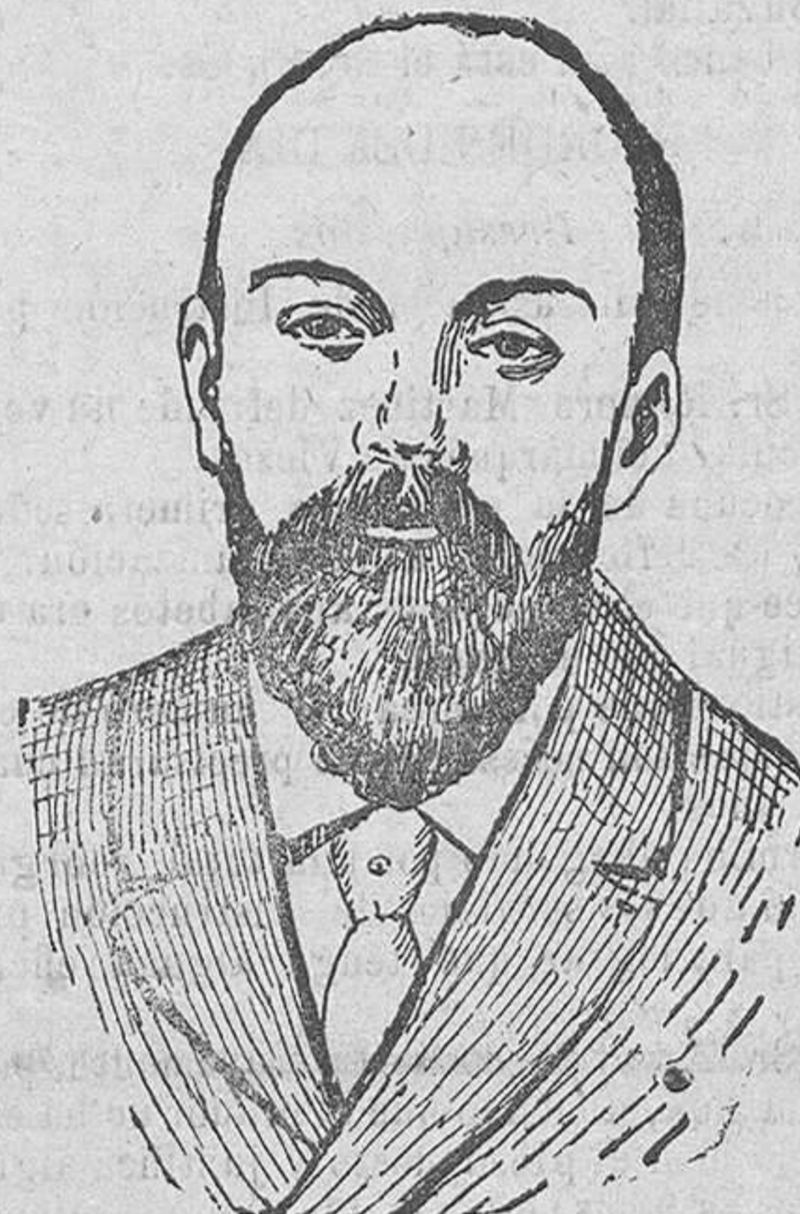
El presidente de la República de los Soviets Sr. Lenin que se encuentra enfermo de un ataque de apoplejía.