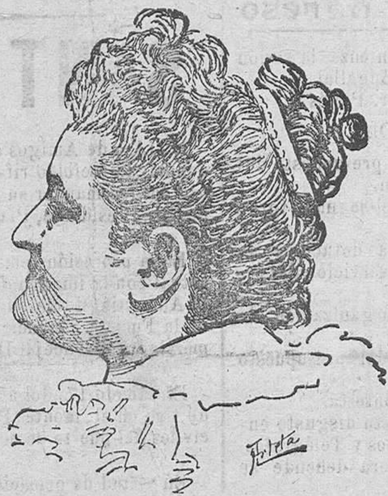
Sra. Condesa de Pardo Bazán, en honor de quien se celebró en el Teatro de la Princesa, en Madrid, un homenaje.