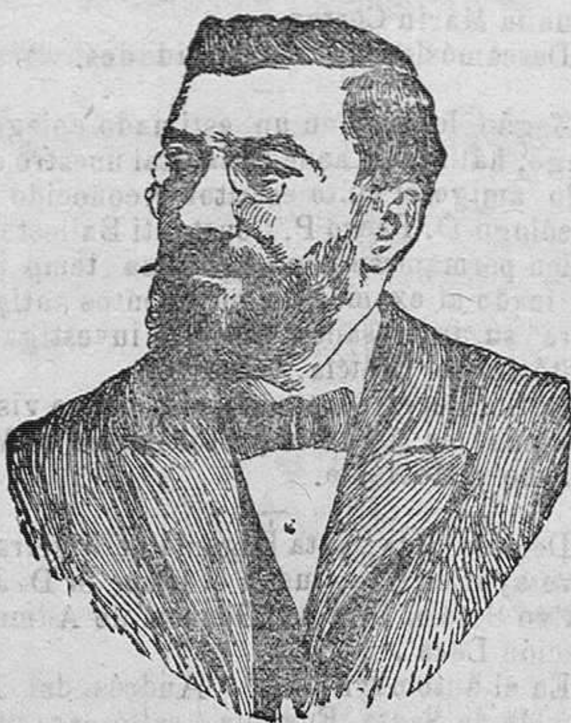
El diputado D. Juan Vasquez Mella que ha sufrido la amputación de la pierna izquierda en el Sonatorio del Doctor Parache.