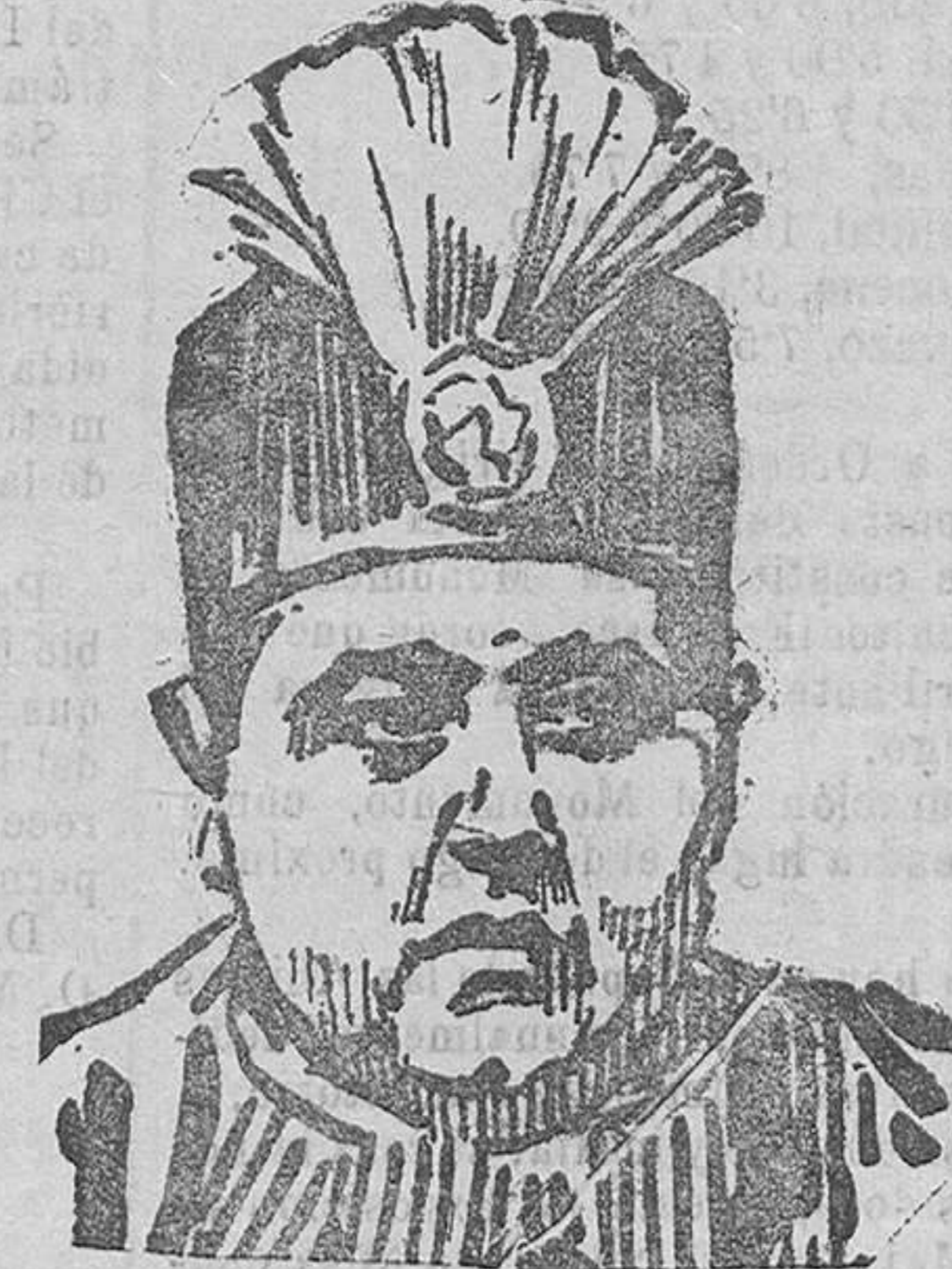
El Shah de Persia que ha sido destronado en virtud de un golpe de Estado.