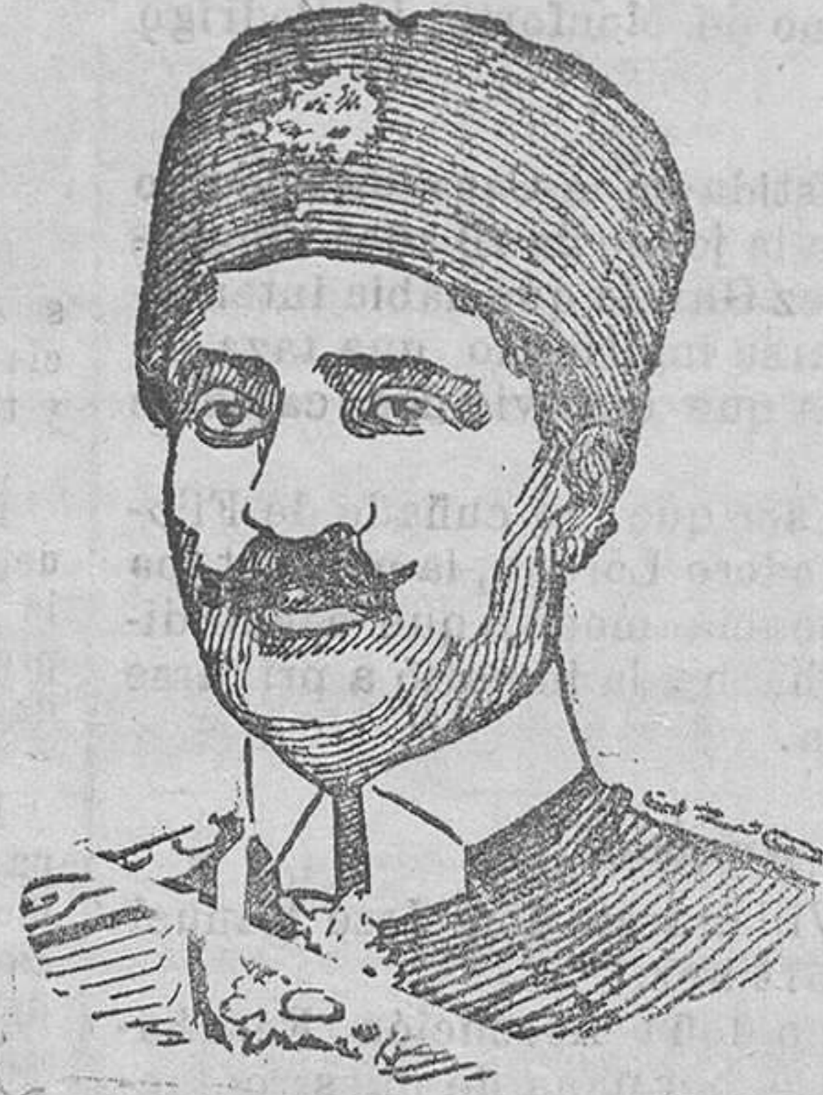
Riza-Khan, primer ministro que era del Gobierno persa y que dio el golpe de Estado destruyendo al Shah desposeyéndole de sus derechos a él y a toda la familia imperial.

El Gobierno turco, que tan radicalmente ha procedido contra el Sultano otomano y contra sus prestigios re-