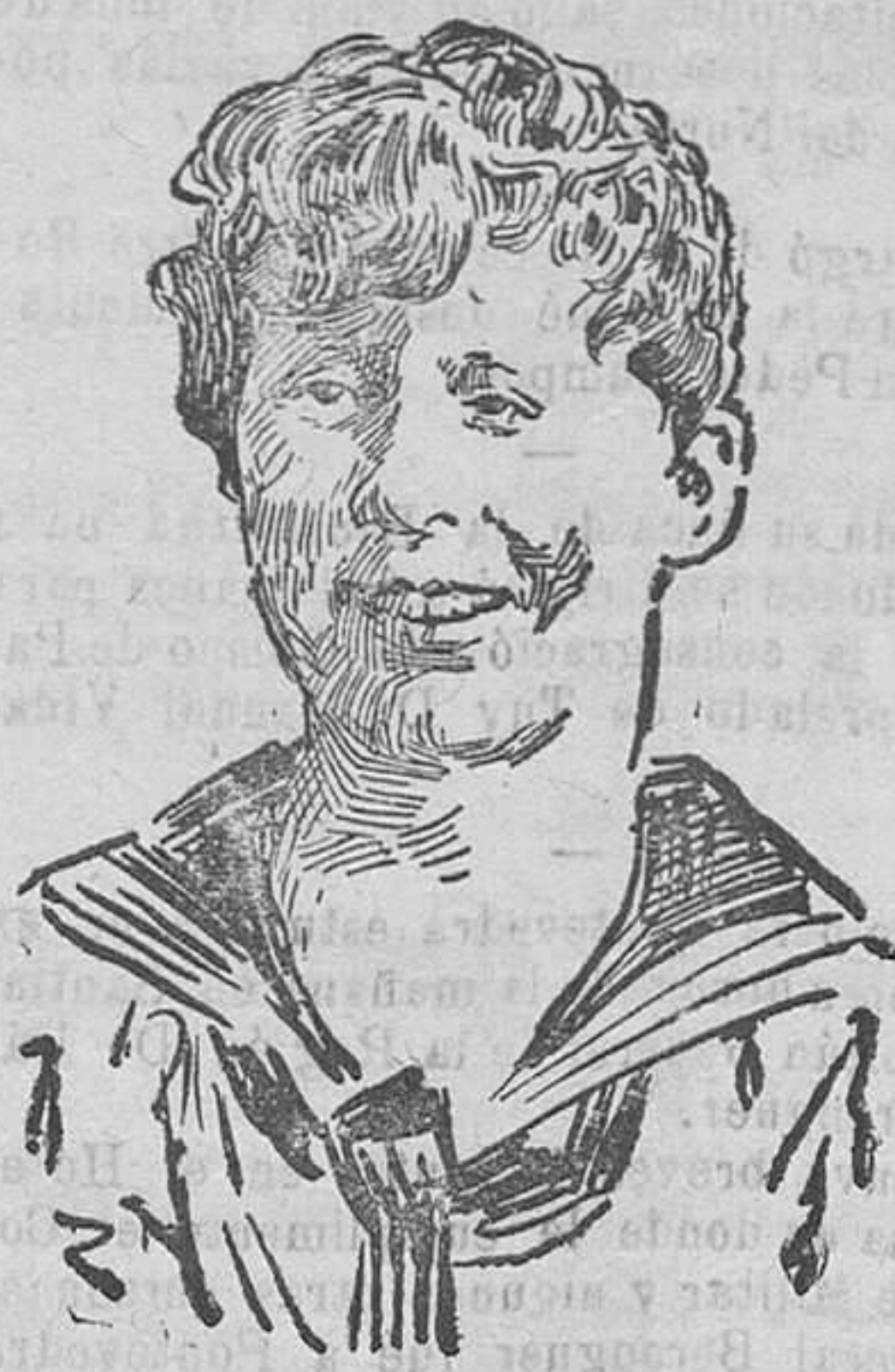
El príncipe Otto, hijo del emperador Carlos, y de la emperatriz Zitta, huéspedes de España, a quien los magiares reconocen como legítimo rey de Hungría

leviáns ronseles de prata como regueiros de estrelas.