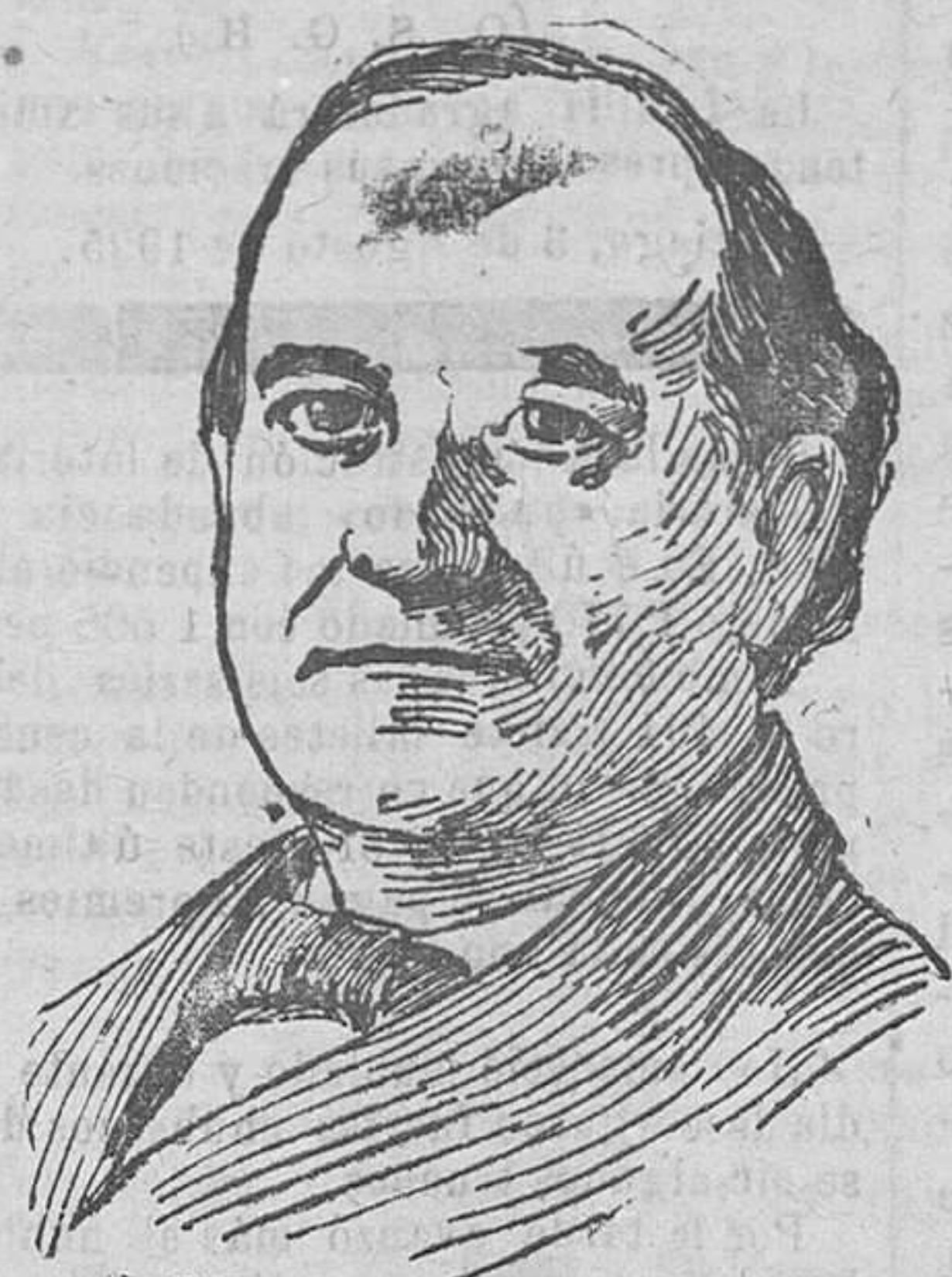
El senador Mr. William Gennings Bryand, que ha fallecido repentina- mente en New-York.

dama de alcurnia recibe en su casa la visita de un amante, que muere de repente. El marido llega y es pre- ciso sacar al muerto sin que aquél se entere.