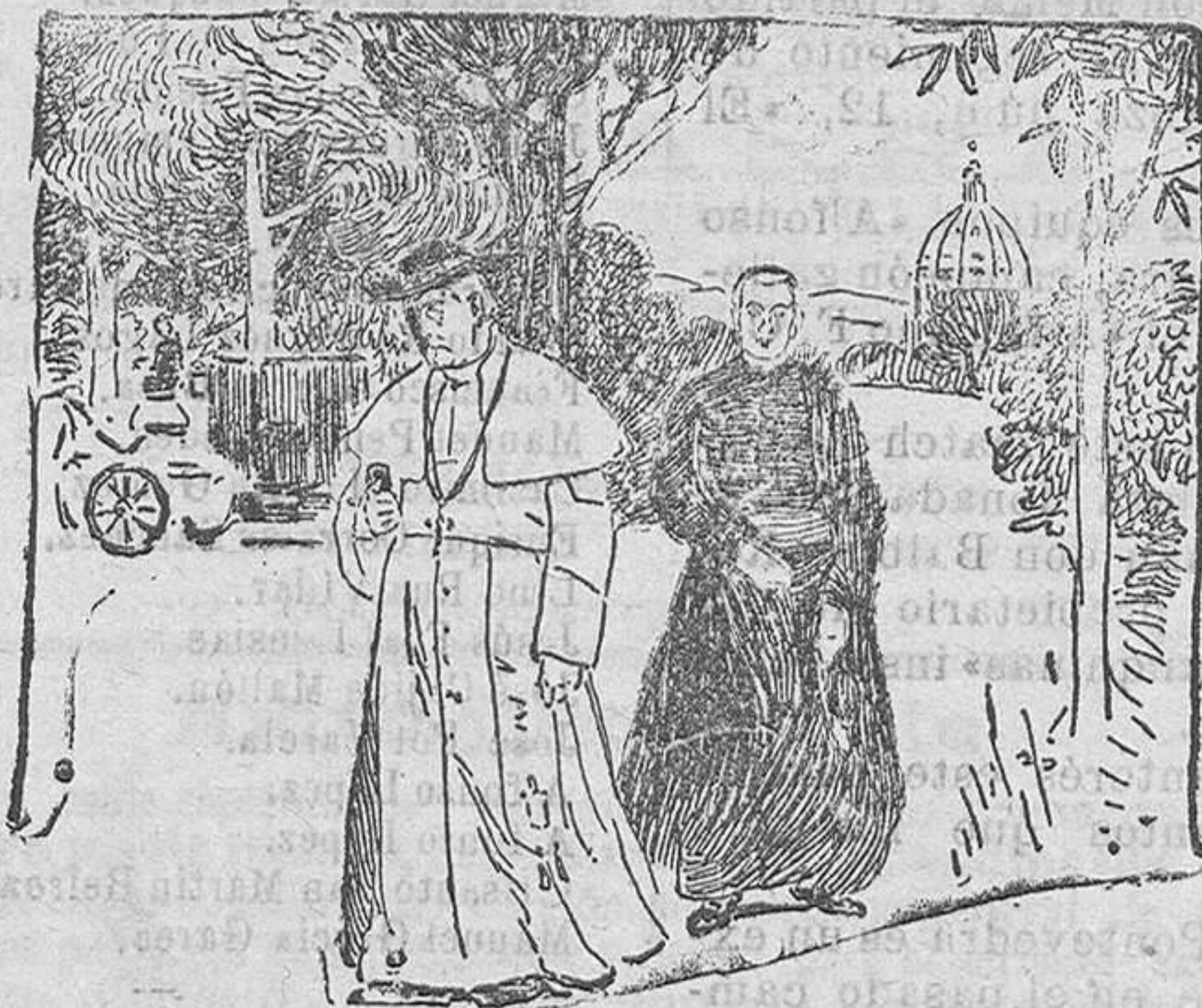
Su Santidad el Papa paseando por los jardines del Vaticano