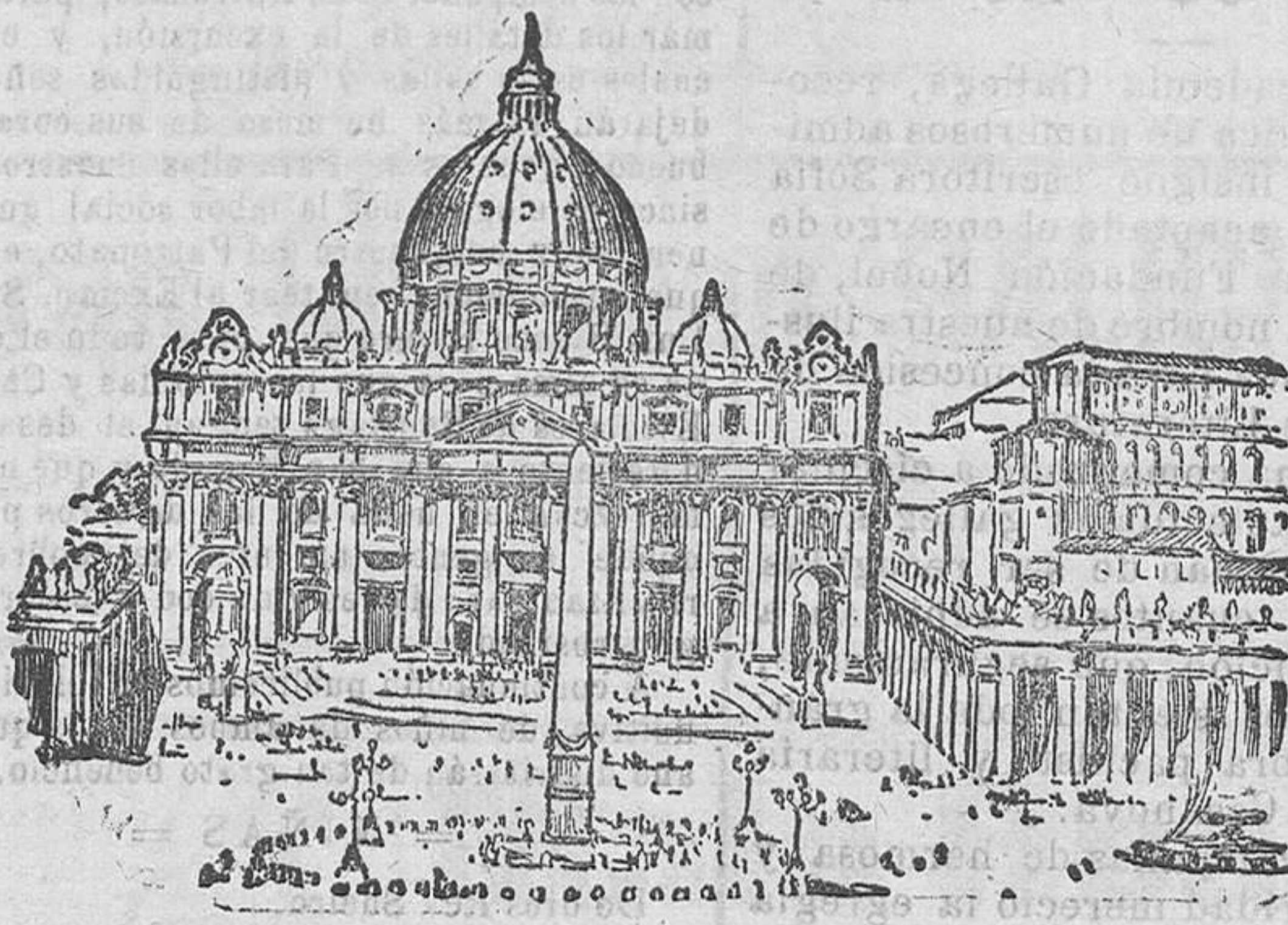
La plaza de San Pedro en Roma donde se levanta el Vaticano

El Papa vive completamente aislado en sus habitaciones particulares, y no hay guardias ni durante el día ni durante la noche. Nadie duerme cerca de él. Tiene tres criados que turnan en su servicio; pero quien realmente lo cuida es una anciana, cuya entrada en el Vaticano ha roto