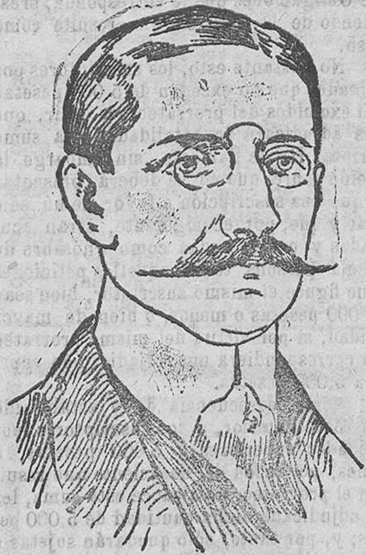
El exministro de Estado de Grecia, Sr. Politis, hace unos días presentó a S. M. las cartas credenciales que le acreditan como Embajador de su país en España.