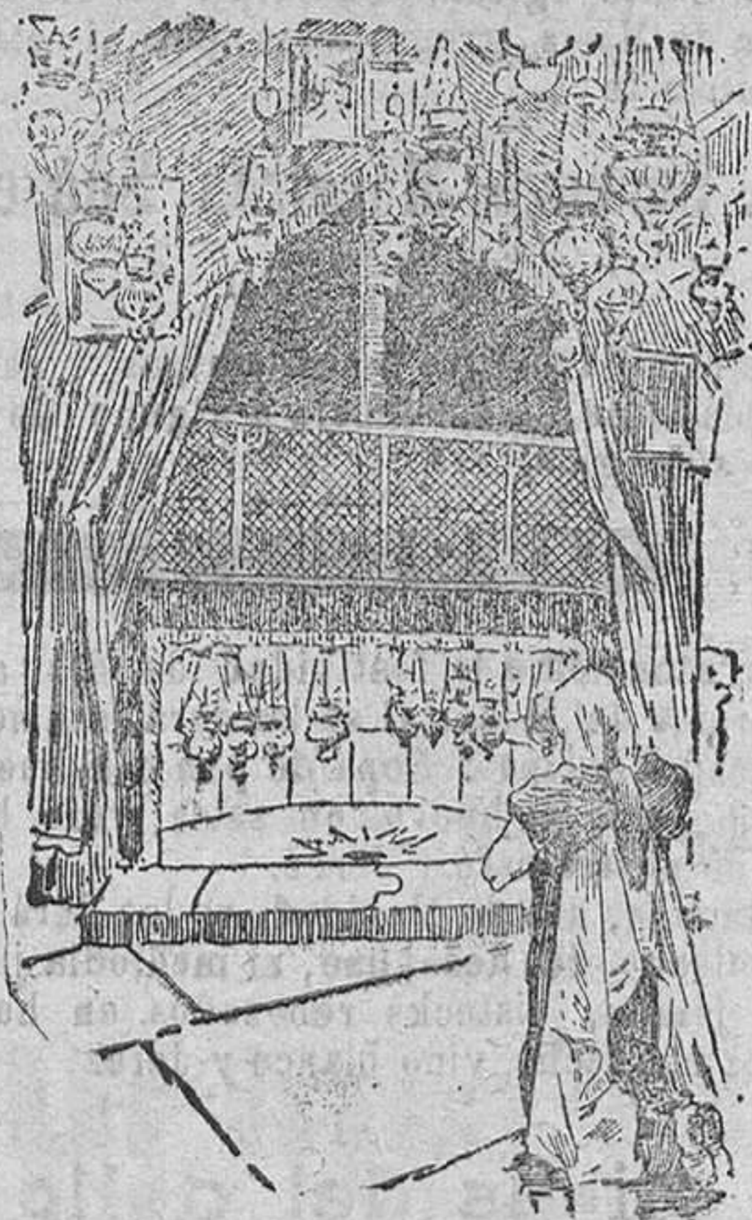
Belén. El nicho del Nacimiento del Salvador como se conserva en la actualidad.