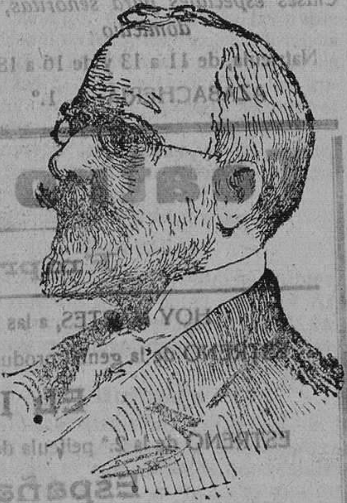
Francisco Pradilla, laureado pintor, recientemente fallecido.