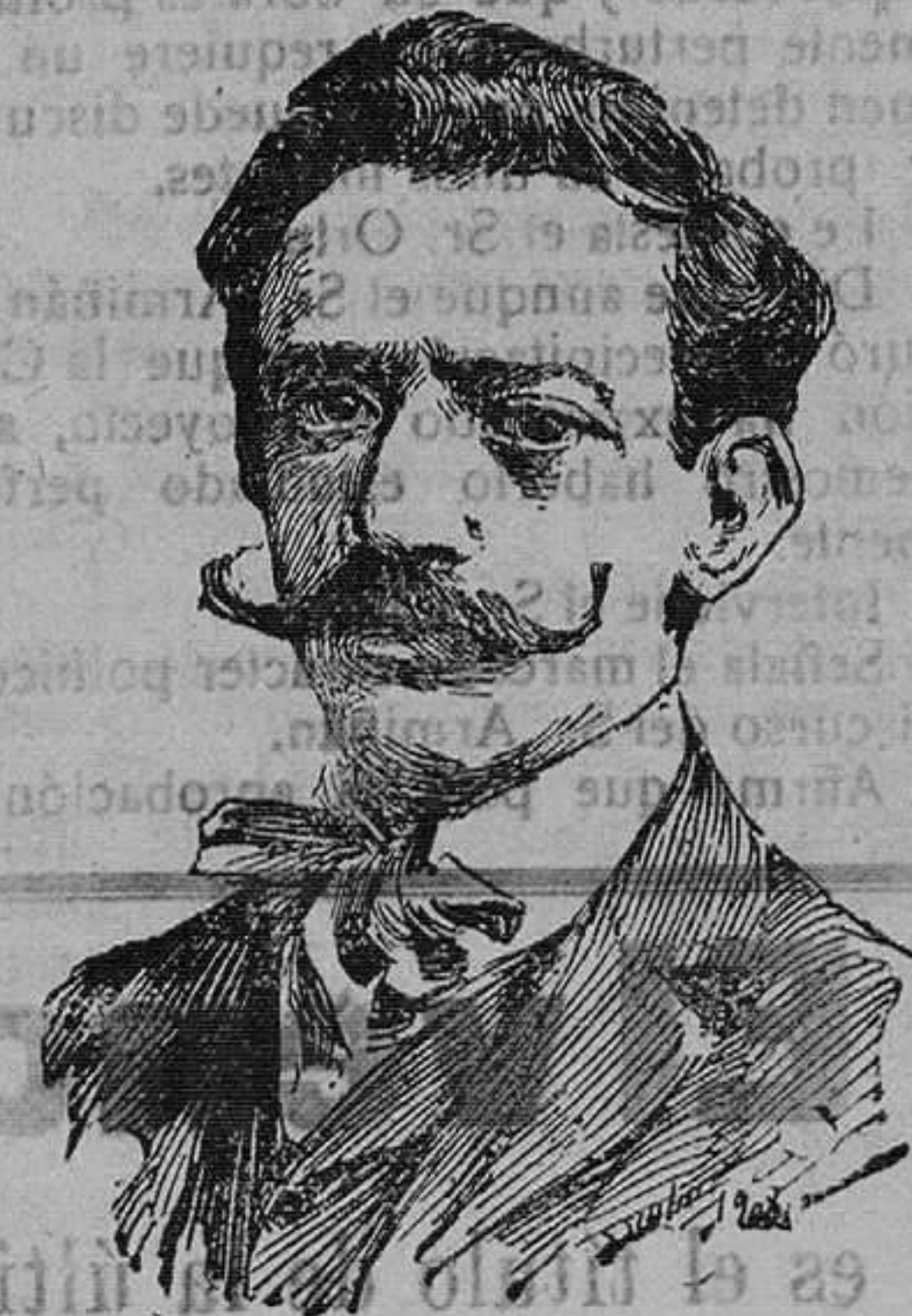
El ilustre literato y periodista Francisco Grandmontagne, a quien un grupo de escritores ha agasajado con una comida típica, celebrada en la Posada de San Pedro en Madrid