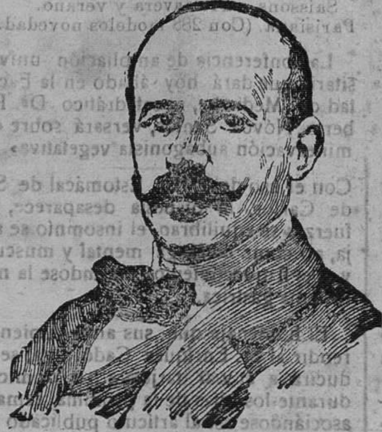
Ignacio Zuloaga, ilustre pintor a quien el Gobierno francés ha nombrado miembro de la Academia Francesa, en la sección de pintura.