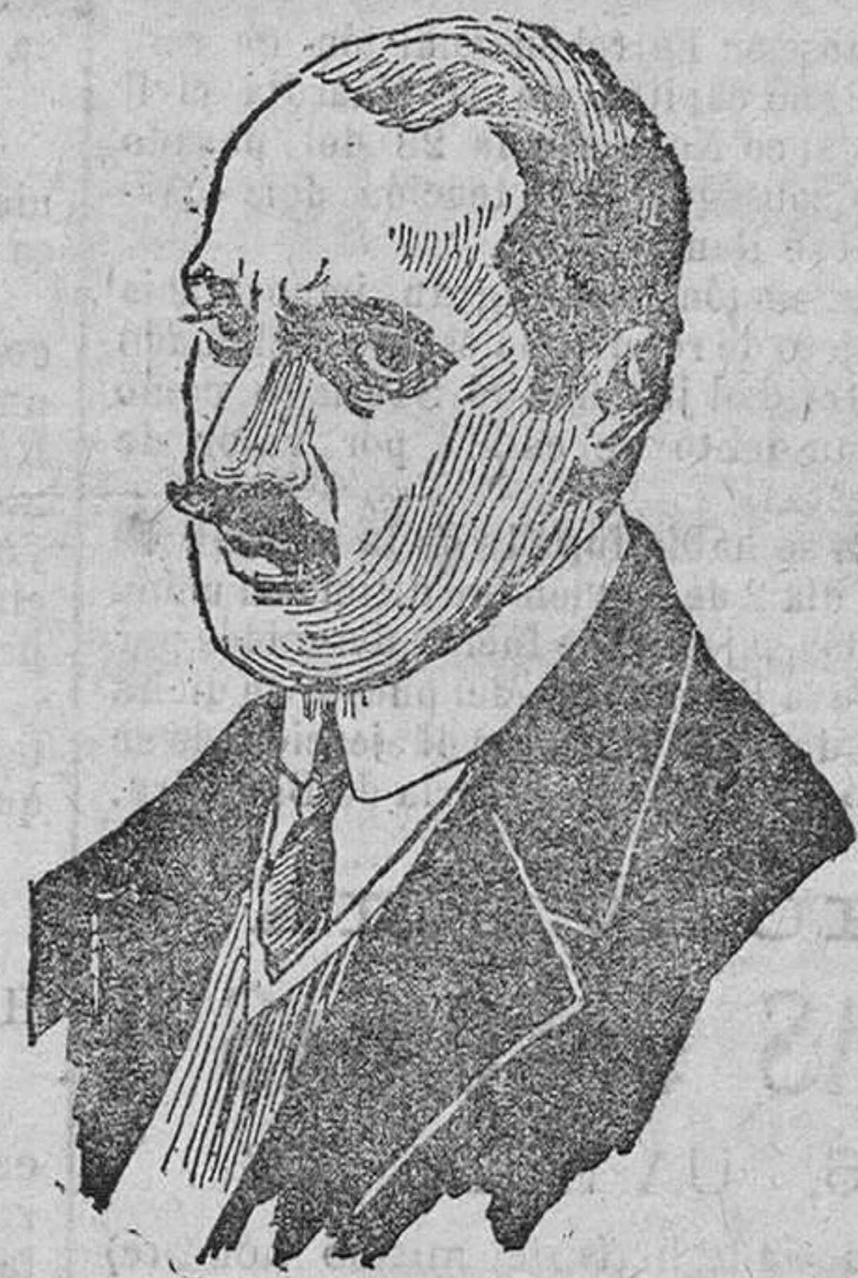
El Conde Karolyi, exministro húngaro, que ha sido procesado y condenado a la confiscación de todos sus bienes, por malversador de fondos públicos y traidor a la patria.