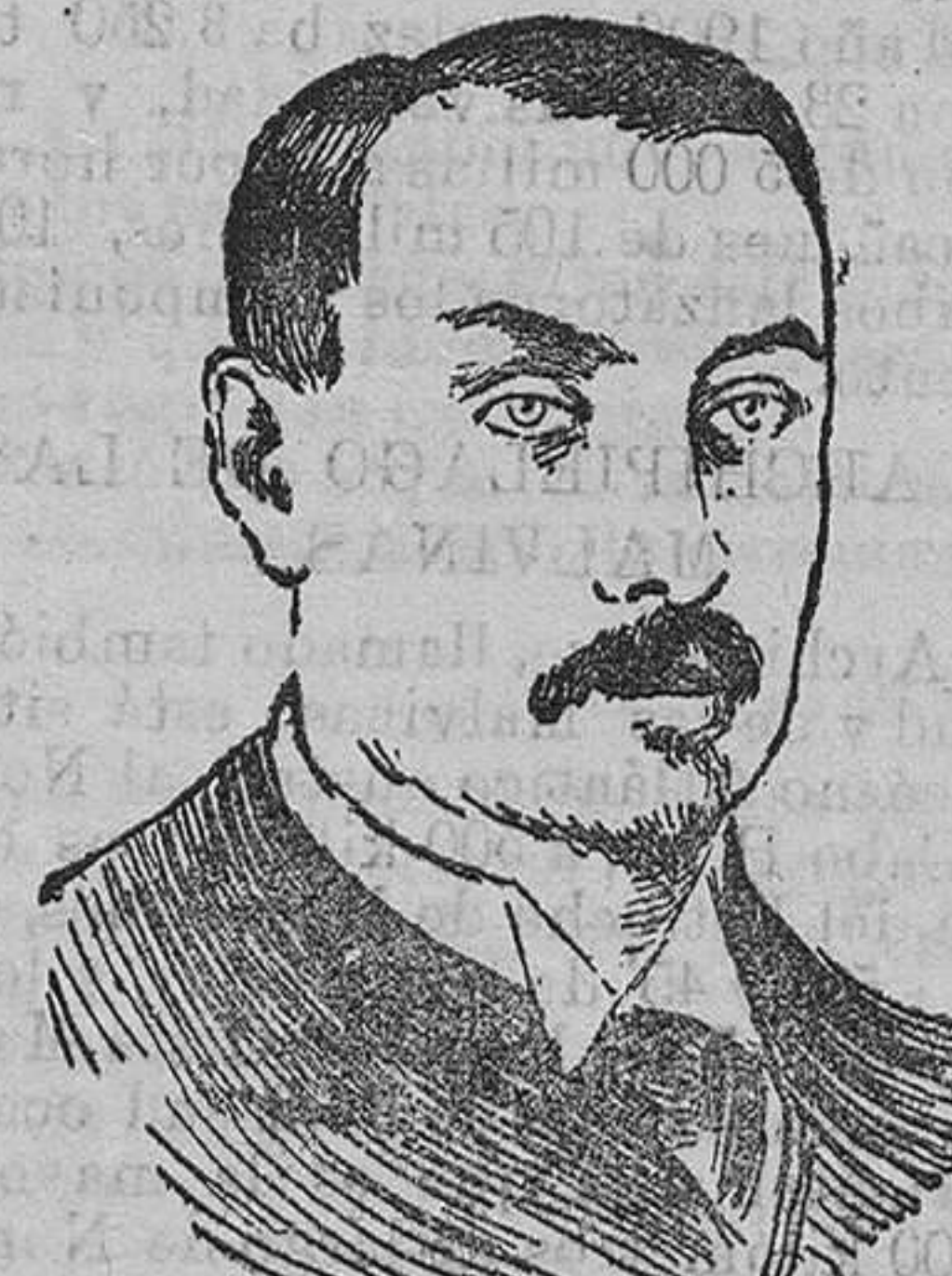
GENERAL LUIS BOTHA que dirige las operaciones contra los rebeldes de Africa