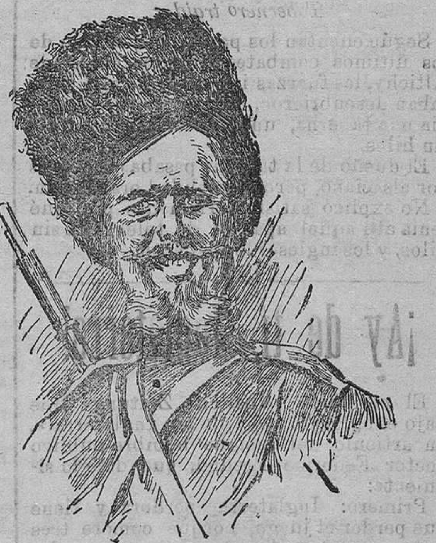
Tipo característico del cosaco del Don

En Rusia, a juzgar por los últimos partes del propio San Petersburgo, vuelven los alemanes a tomar la ofensiva. En Prusia oriental era indudable; pues hace varios días que se viene señalando, y otro tanto ocurre en Galicia. En el Vístula central es donde podría darse, ya que allí es donde los rusos consiguieron derrotar a las tropas alemanas y desorganizar Varsovia. Hace dos días se señaló la presencia de los rusos, persiguiendo a los