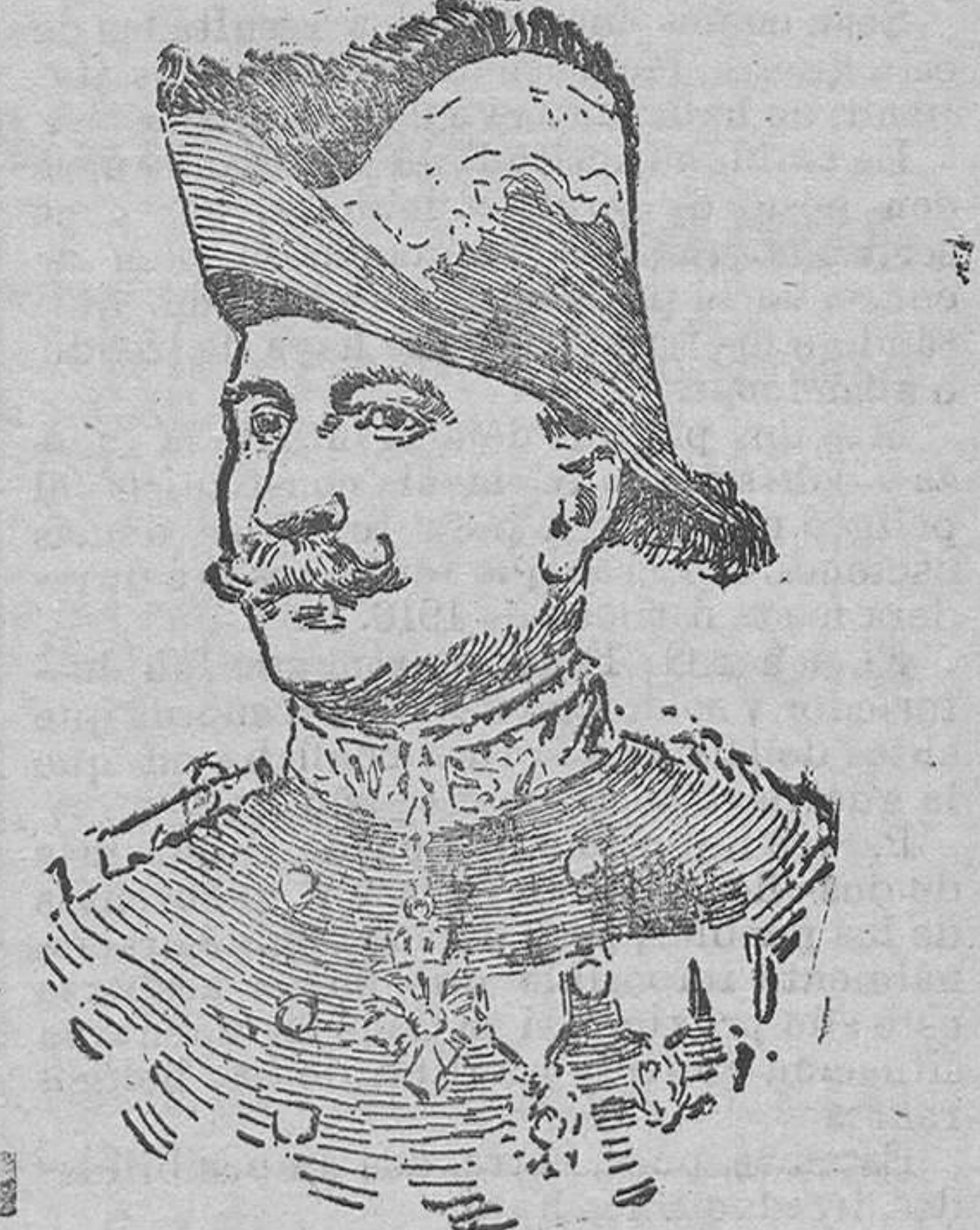
GENERAL MOUD'HUAY A cuyas órdenes operan los cazadores alpinos, llamados por los alemanes «diablos azules»

Percatóse en seguida el generalísimo francés de la situación. Los alemanes, más numerosos y mejor organizados, iban a imponerse. Esperarles en las pizcas fortificadas de la línea establecida por La Fère era una locura; pues los cañones de 42 hacían inútil la resistencia. Sólo había un medio: ceder apresuradamente el terreno; buscar el apoyo del campo atrincherado de París, lo mismo que en el Este se había buscado el de Verdun; dejar que el enemigo, a fuerza de penetrar en el territorio, debilitase su ala izquierda, que era la que desarrollaba el envolvimento; reconstituir, en tanto, a retaguardia los efectivos, para que los depósitos de tropas frescas pudieran funcionar constantemente, y en esas condiciones librar la batalla.