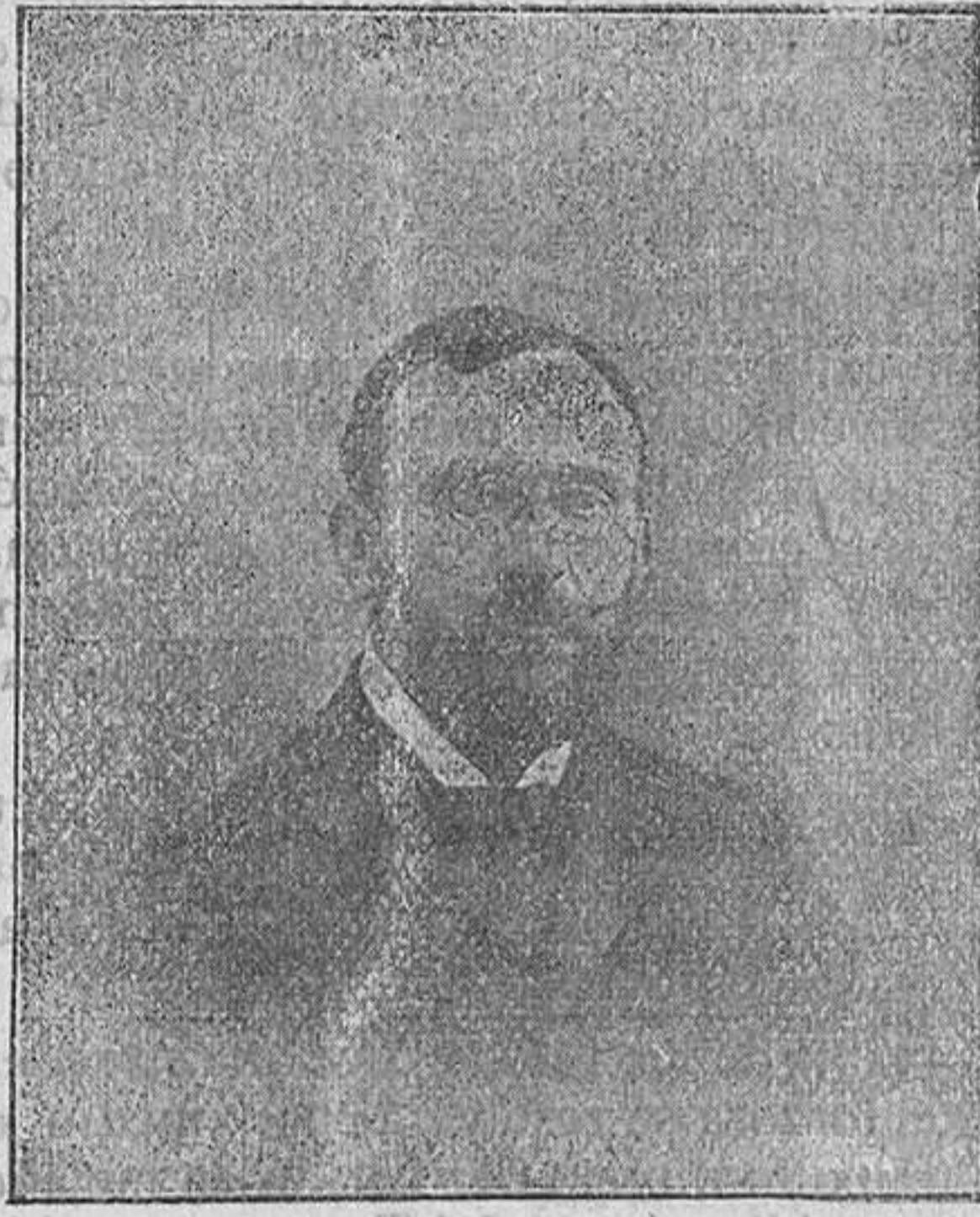
Excmo. Sr. Marqués de Figueroa

Refiere a la conmoción que sufre el mundo civilizado en la actual guerra, y cuyo resultado es aún una incógnita pero que seguramente habrá de aportar nuevos valores a la vida pública y recuerda que algo análogo hizo la revolución francesa aboliendo el antiguo régimen.