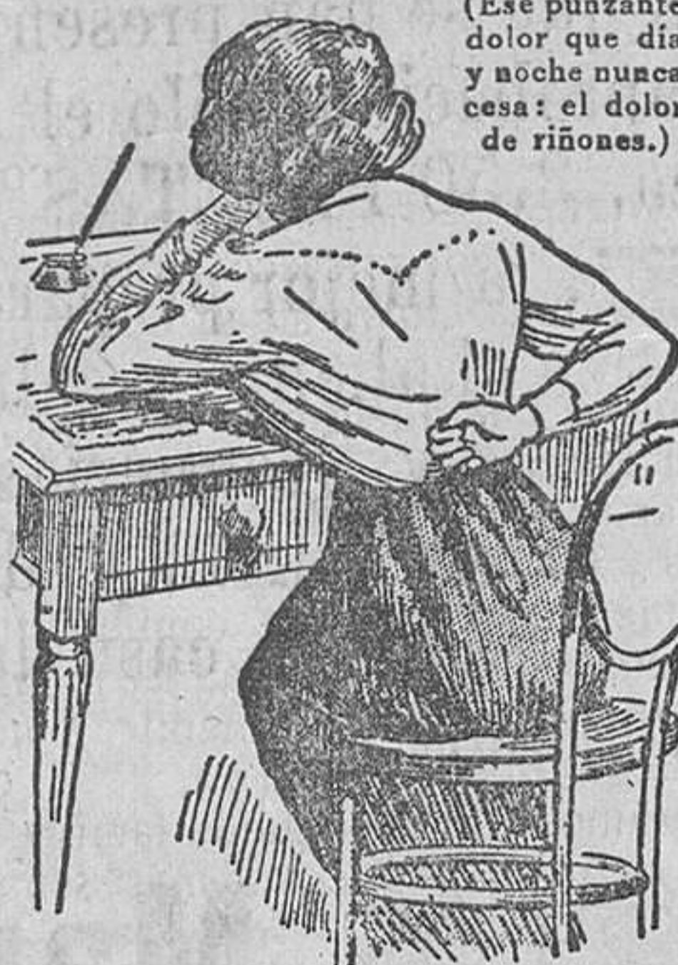
(Ese punzante dolor que día y noche nos causa: el dolor de riñones.)

Para curar toda especie de dolor de riñones, es menester en absoluto que se suprima la causa: el ácido úrico tóxico. Para ello, un remedio verdadero debe atravesar los riñones y la vejiga y no los intestinos, como sucede con la mayor parte de píldoras para los riñones. Cuando observe que la orina toma un tono azul turbio — efecto peculiar de las Píldoras De Witt — queda seguramente avisado de que las píldoras han ejercido su salutífera acción en el sitio dañado: riñones y vejiga. — Es una maravillosa píldora que obra sobre los riñones, y por eso las Píldoras De Witt producen tan rápido alivio a cada prueba. La cura definitiva viene luego en casi todos los casos. Trate de obtener aquel tono azul de la orina.