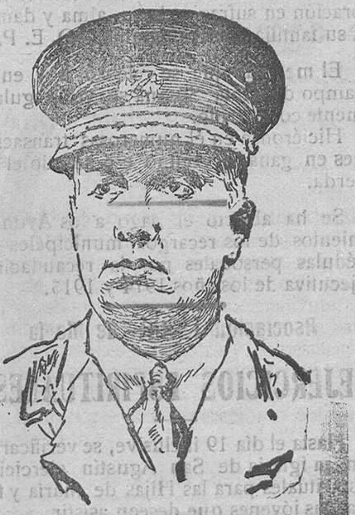
General A. Currie, comandante de las tropas canadienses de Francia.