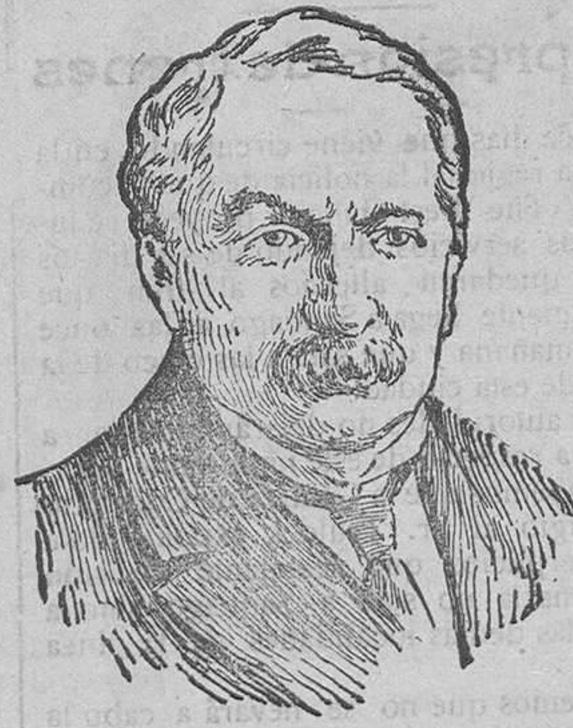
Lloyd George, ministro inglés que se halla en París, con motivo de las conferencias interaliadas.