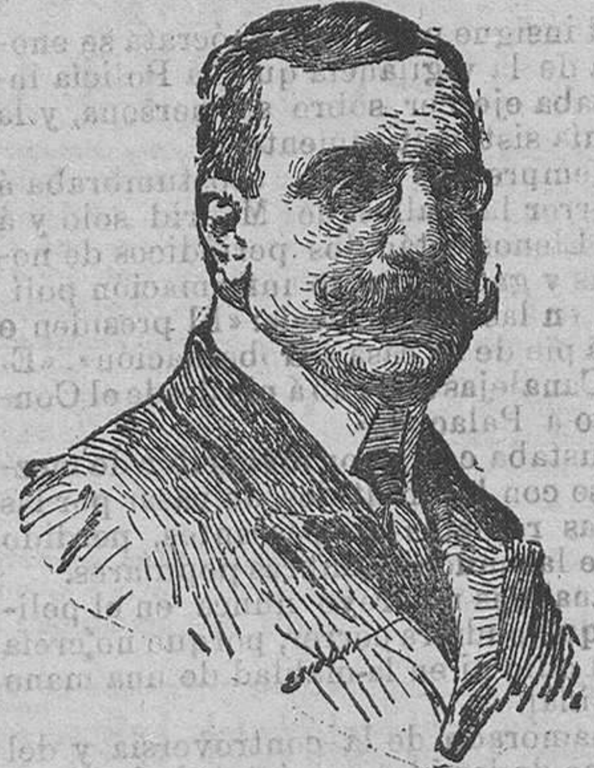
D. JOSE CANALEJAS

Y otros apóstoles de la Ciencia y de la razón, que no saben de la vida porque constantemente la huyeron, tal vez incapaces de sentirla con toda su ardiente intensidad, acumulan en libros y en discursos frías deducciones de una lógica sin alma más fría aún; estultos armazones de teorías construidas como si la vida pudiese ser regulada por leyes puramente mecánicas, inflexibles como las piezas de acero de una máquina, y esas teorías, al caer después como fulminantes sobre cerebros explosivos, vienen a transformar en tigre a un cordero de El Grado, para que la provincia oscense tenga una fiera que poner como pendant a su león.