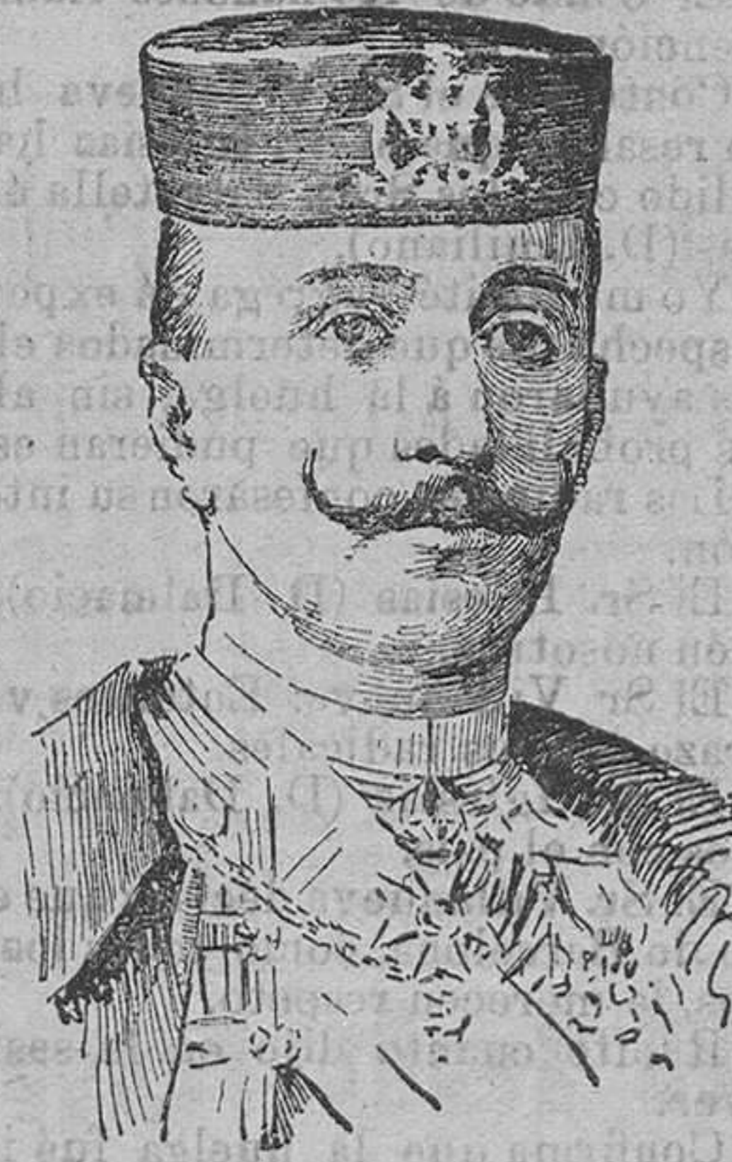
El príncipe Mirko de Montenegro, vencedor de los turcos en la batalla de Tuzi.