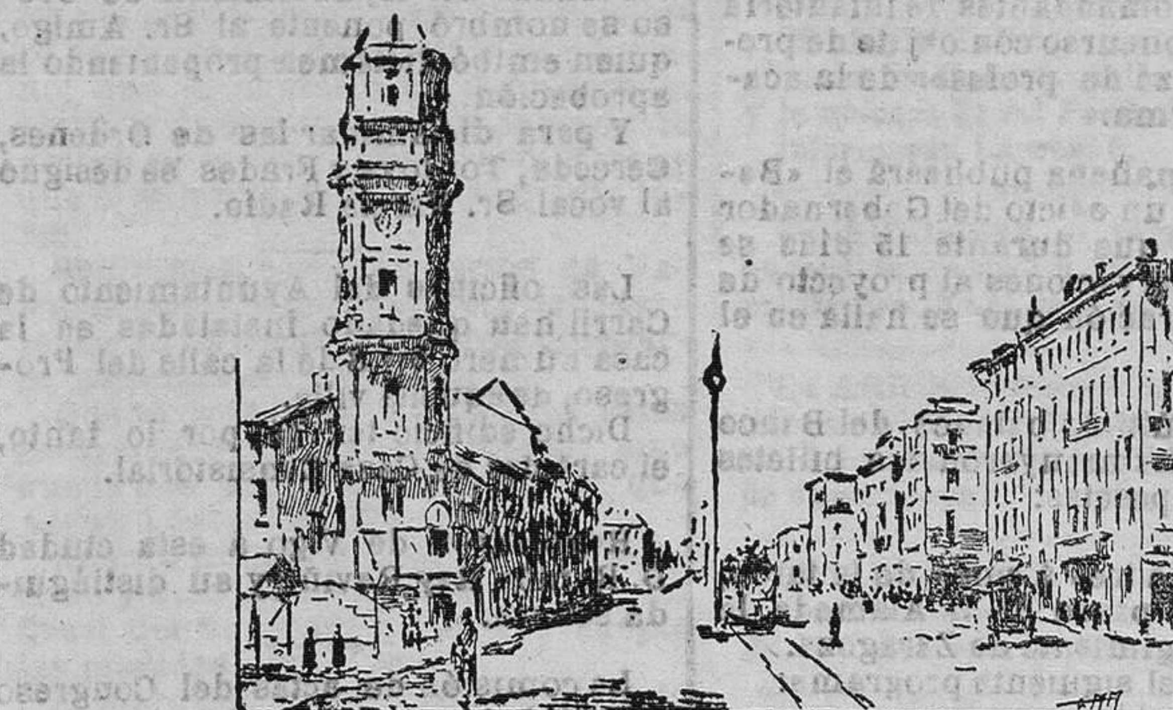
LA PERSPECTIVA NEWSKY.—A la izquierda la casa de la municipalidad.

El periódico ABC explica en los términos siguientes la forma que pue-