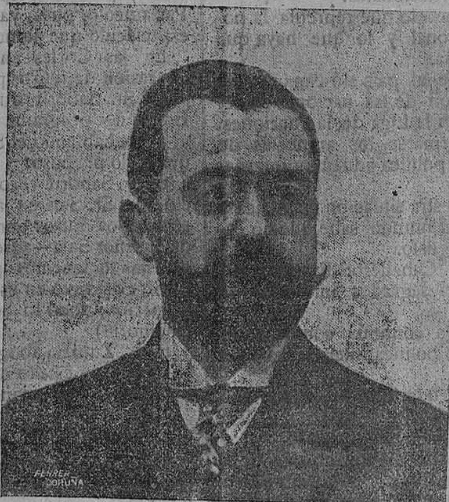
Excmo. Sr. Conde de Bugallal, ilustre político gallego nombrado Ministro de Hacienda.