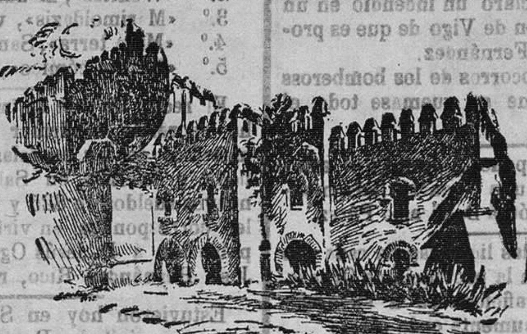
Las cacerías del Rey