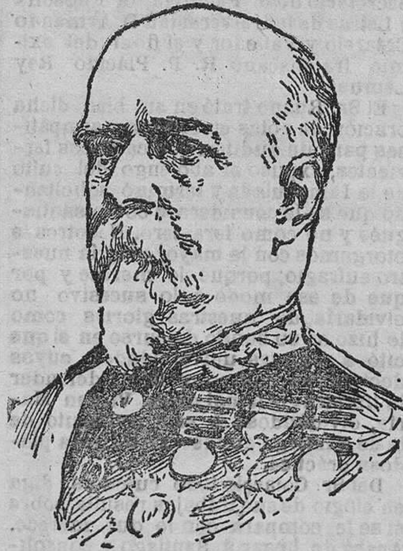
EL GENERAL AZCÁRRAGA Presidente del Consejo de Ministros

Los principales ministros de cultos holandeses han hecho la apología de las virtudes del difunto.