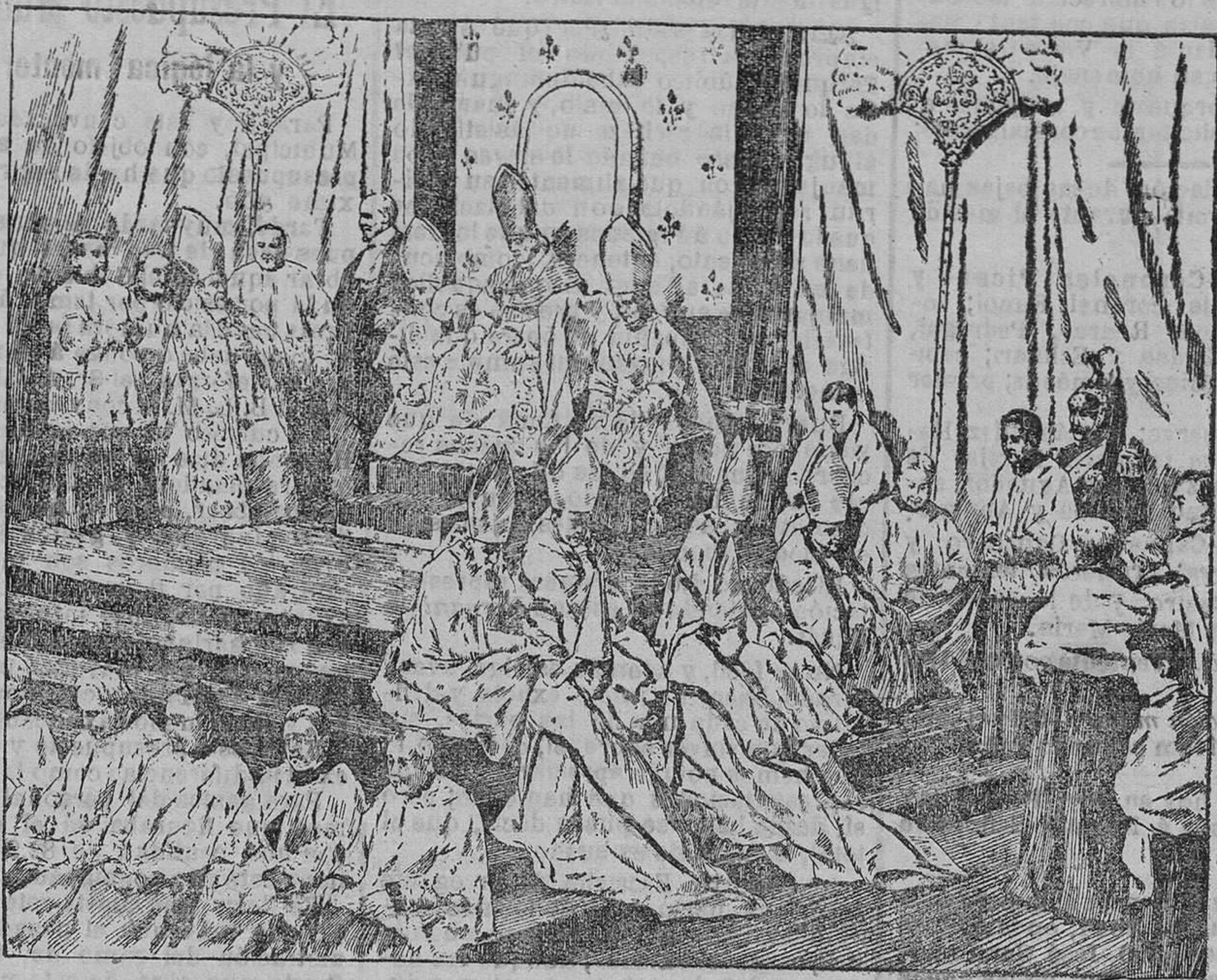
Su Santidad el Papa en el Trono Pontificio de la Basílica de San Pedro, asistiendo á la ceremonia del quincuagésimo aniversario de la proclamación del dogma de la Inmaculada Concepción.