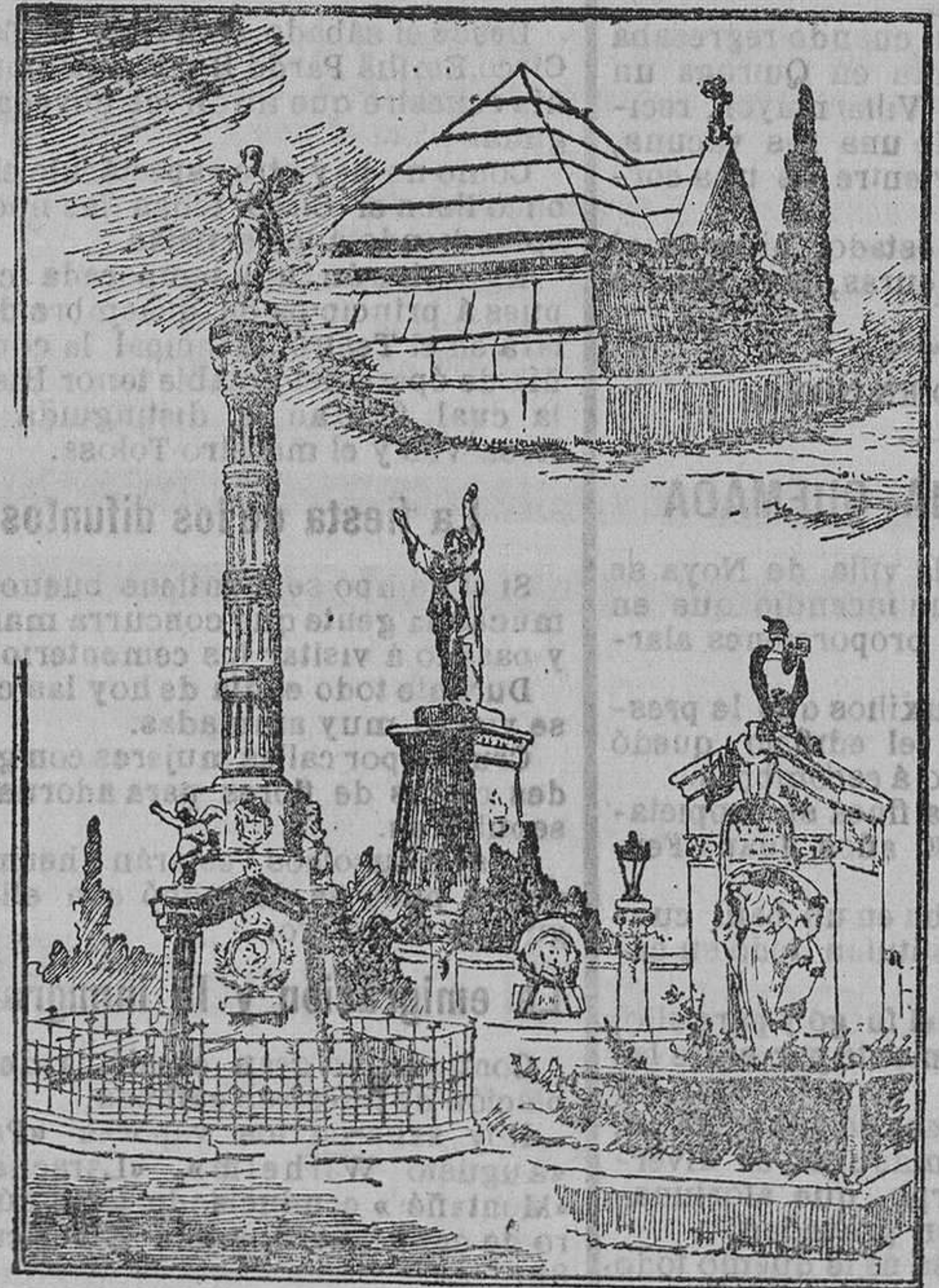
Panteones de los Cementerios de San Isidro y San Justo, de Madrid

El Rey aprobó la conducta del Gobierno en tales términos, que el señor Maura, en medio de la preocupación que le embarga, tenía que mostrarse satisfecho, fundándose en eso, más