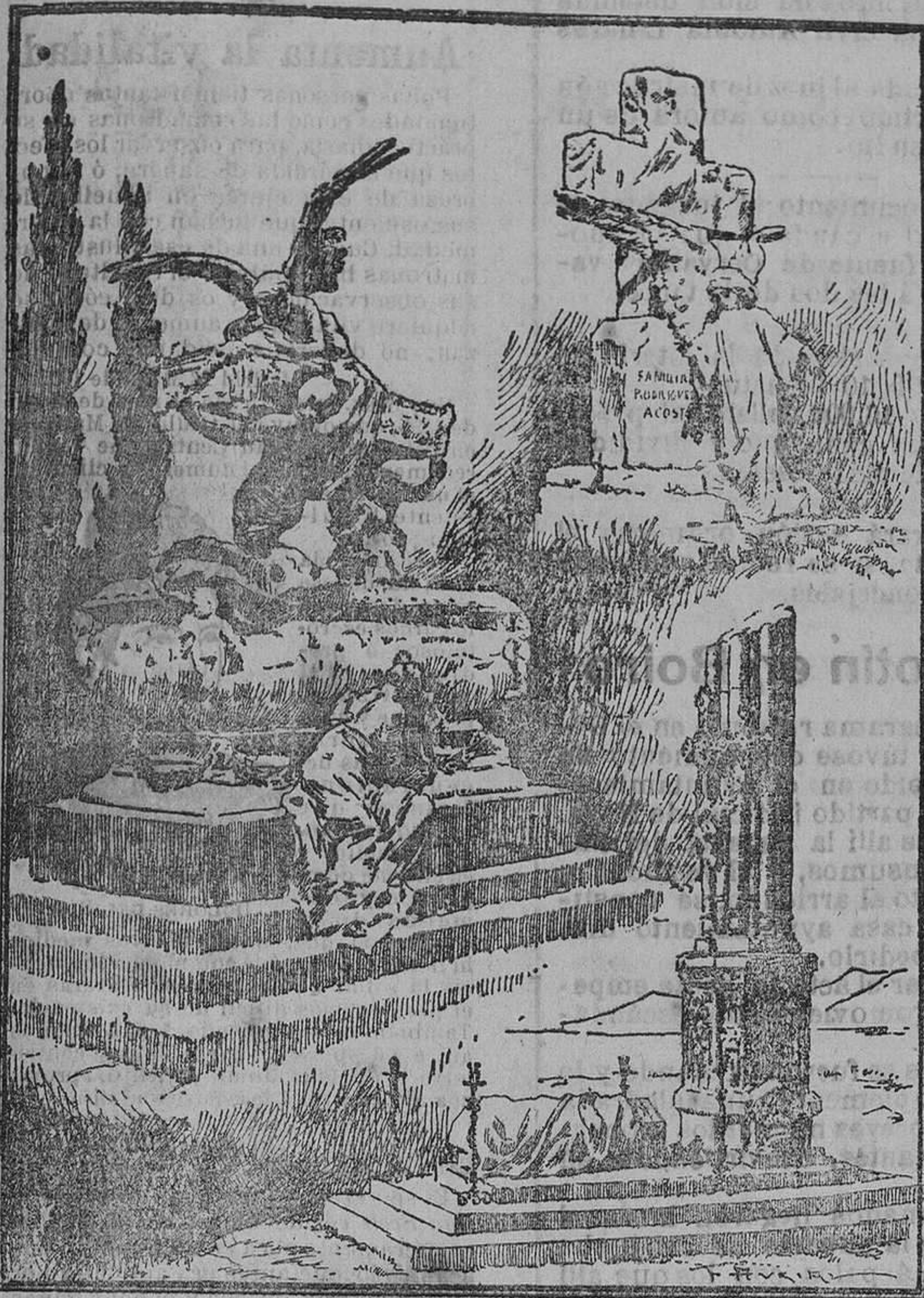
Sepulcro de Gayarre, de la familia Rodríguez Acosta, y de los marinos víctimas de la explosión del «Machichaco», en los cementerios del Roncal, Granada y Santander