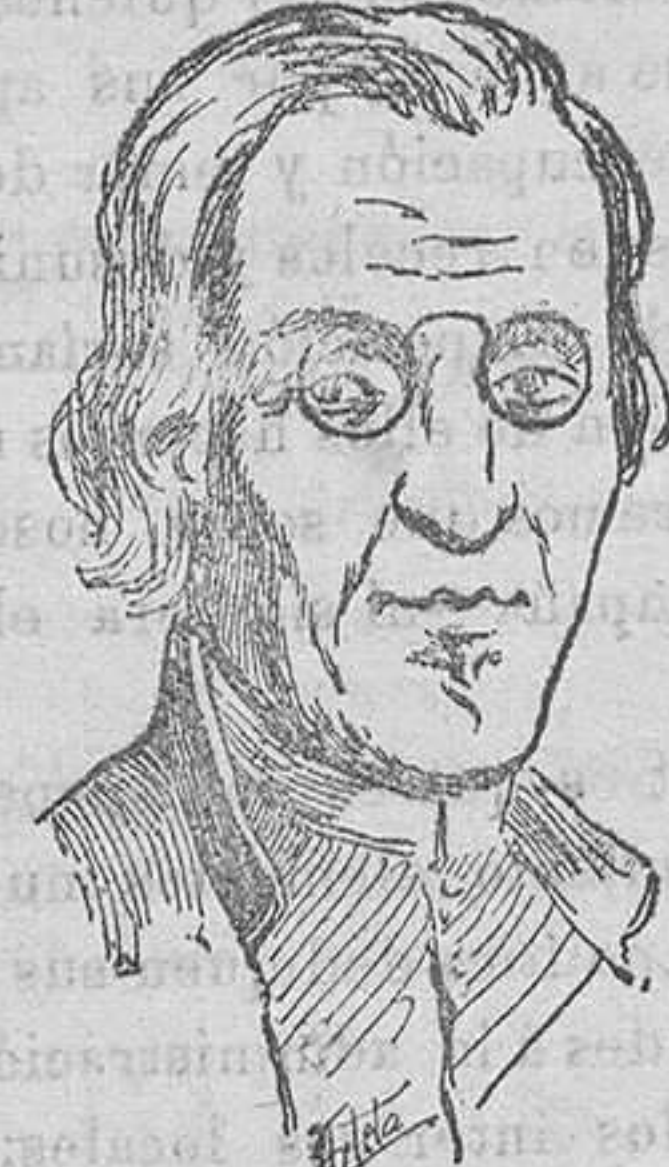
D. ANTONIO SOLÍS

En la Universidad de su cuna estudió Filosofía y Letras, y las inclinaciones que desde muy joven demostró por la literatura, le condujeron a ser uno de sus más fervientes y meritorios cultivadores de su época, y fué insigne poeta dramático y lírico.