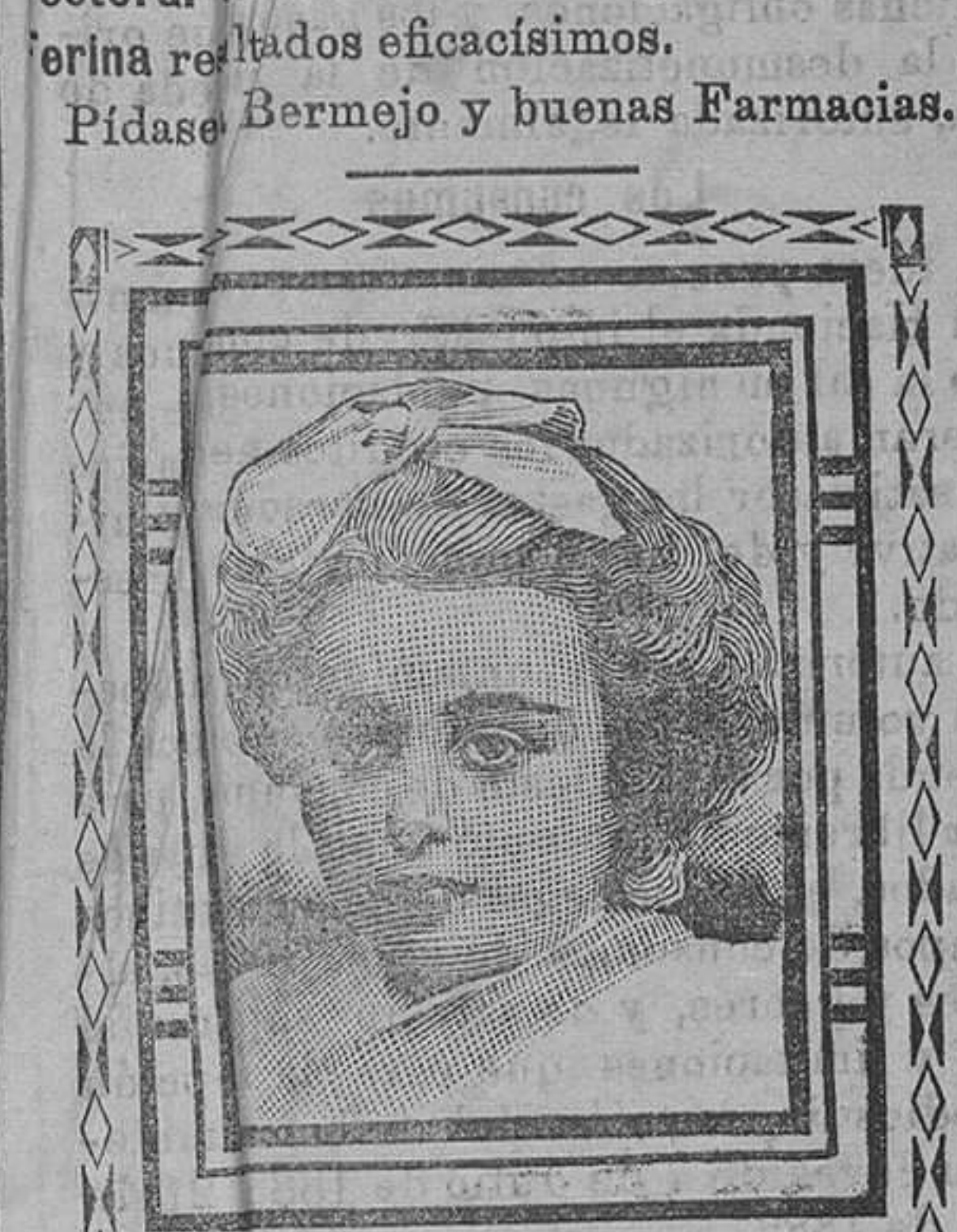
Barcelona, 11 Febrero 1908.

Tos y enfermedades del pecho lo mejor es el TOS FERINA. Cura siempre. En la TOS FERINA resultados eficacísimos. Pídase Bermejo y buenas Farmacias.