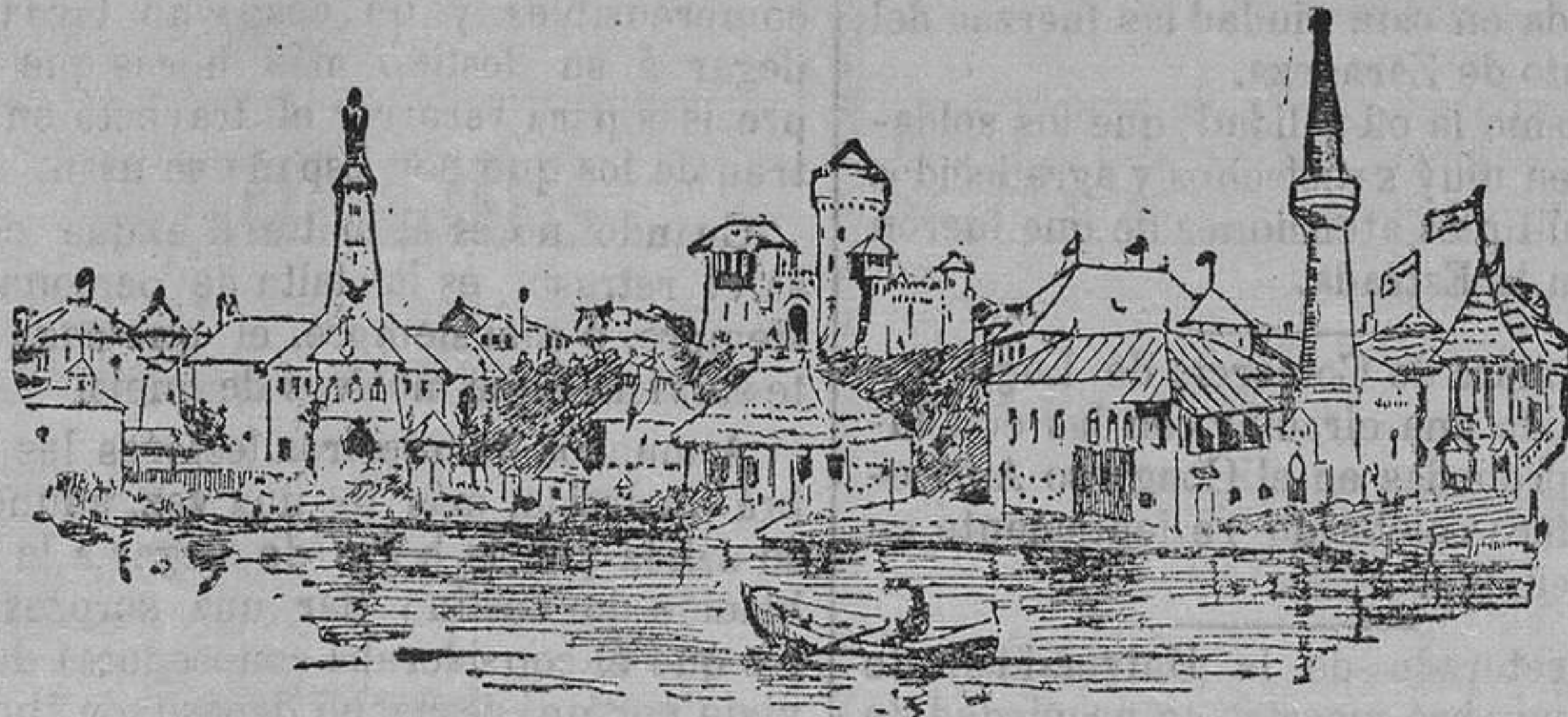
LA EXPOSICIÓN DE BUCAREST EL LAGO Y LAS CONSTRUCCIONES CARACTERÍSTICAS DEL PAÍS

La Exposición de Bucarest es la primera que allí se celebra y honra a la patria de Carmen Sylva. No se ha tratado de hacer una de esas dispendiosas exposiciones, donde, como la desgraciada de Milán, los resultados positivos quedan muy por bajo de los sacrificios pecuniarios, sino de un concurso serio, escogido y tanto más digno de atención cuanto que se encierra dentro de los moldes de un marcado espíritu nacional.