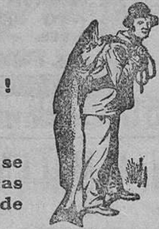
Obténngase siempre la Emulsión con esta marca “El Pescador”, marca del procedimiento Scott!