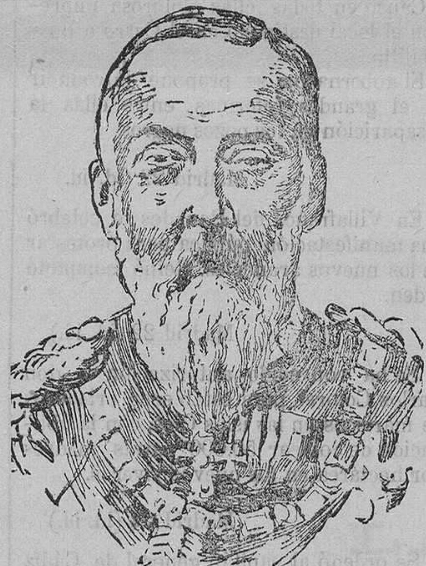
EL PRÍNCIPE LEOPOLDO regente de Baviera

En tanto, pensar en ambiciones que sólo pueden halagar el amor propio sin beneficio para el Estado; buscar á la vez, en los pálidos albores de la decrepitud, un rango y una altura gerárquica que no le corresponden; pretender rehacer en pleno siglo XX la antigua triste historia del infeliz Delfín de Francia «Máscara de hierro», recluso en un calabozo como el actual rey de Baviera; y en fin, demostrar impaciencia cuando la tranquilidad y el desinterés, precursor de una próxima desaparición del mundo de los vivos, deben dejar serenamente, sin obligadas precipitaciones, que los acontecimientos pongan en sus manos el cetro de Baviera, es poco menos que un síntoma de vesania y á buen seguro prueba de una ambición censurable.