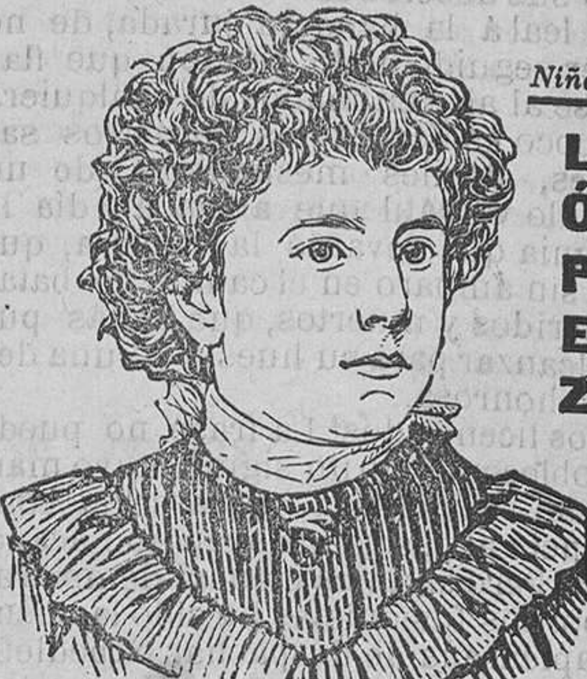
Barcelona 4 de Marzo de 1902.