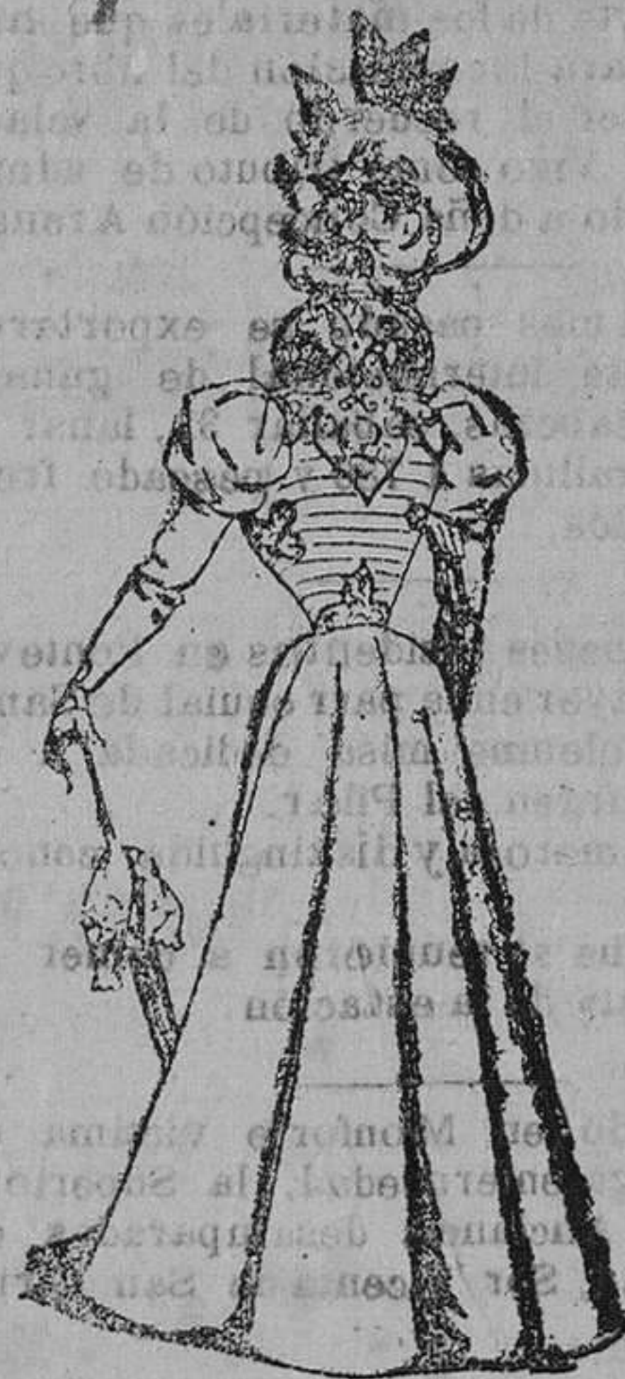
Traje para visita.

Modelos exclusivos para nuestras lectoras de los Grandes Almacenes de EL SIGLO, Barcelona